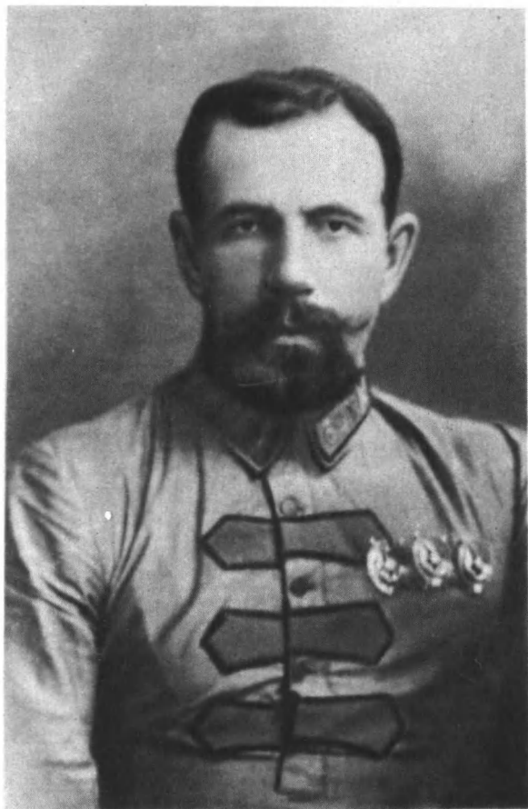
П. Е. Дыбенко. 1923 г.