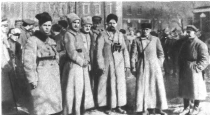
П. Е. Дыбенко среди командиров и бойцов — участников подавления кронштадтского мятежа. Март 1921 г.