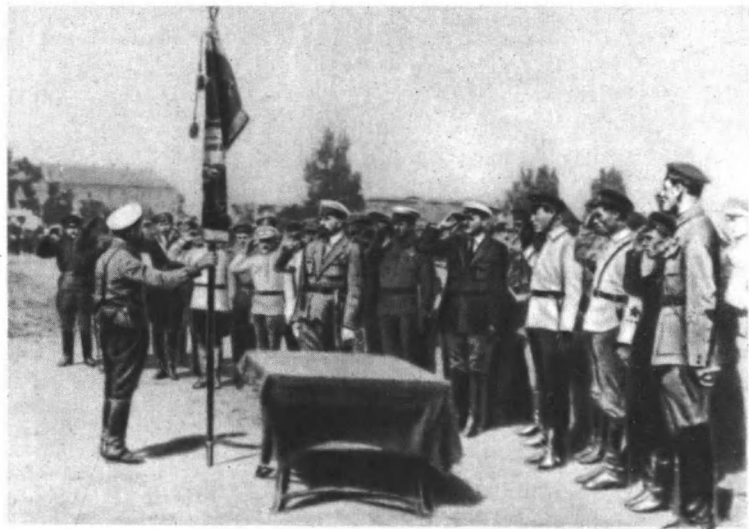
М. В. Фрунзе вручает красное знамя начальнику 51-й стрелковой дивизии П. Е. Дыбенко. 1921 г.