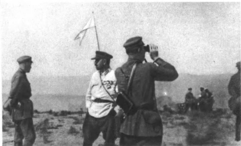
Командующий Среднеазиатским военным округом П. Е. Дыбенко во время учений в районе г. Кушки. 1929 г.