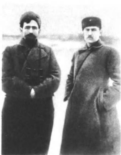
П. Е. Дыбенко и И. Ф. Федько Кронштадт. Март 1921 г.