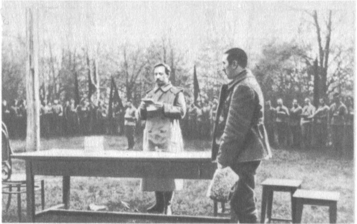
Н. И. Подвойский принимает присягу у бойцов дивизии В. И. Киквидзе. 1918 г.