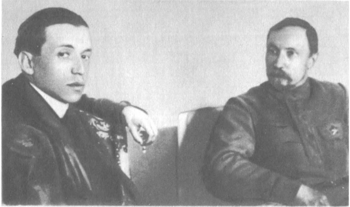
Н. И. Подвойский и венгерский коммунист Тибор Самуэли. 1919 г.