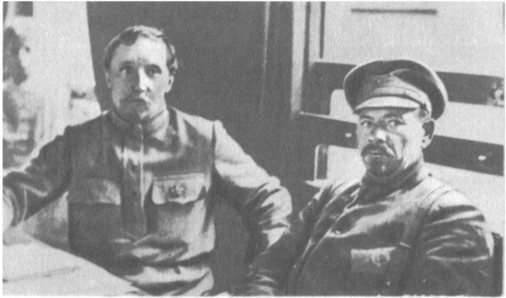
Н. И. Подвойский и комбриг В. Н. Боженко во фронтовом поезде. 1918 г.