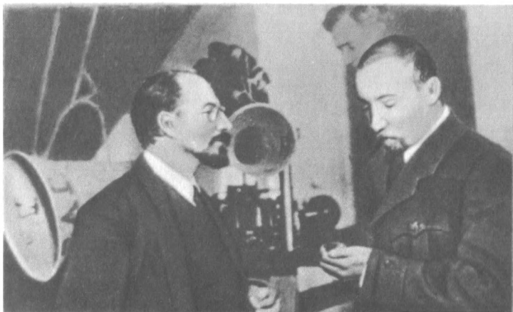
А. В. Луначарский и Н. И. Подвойский во время записи на граммофонные пластинки. 1919 г.