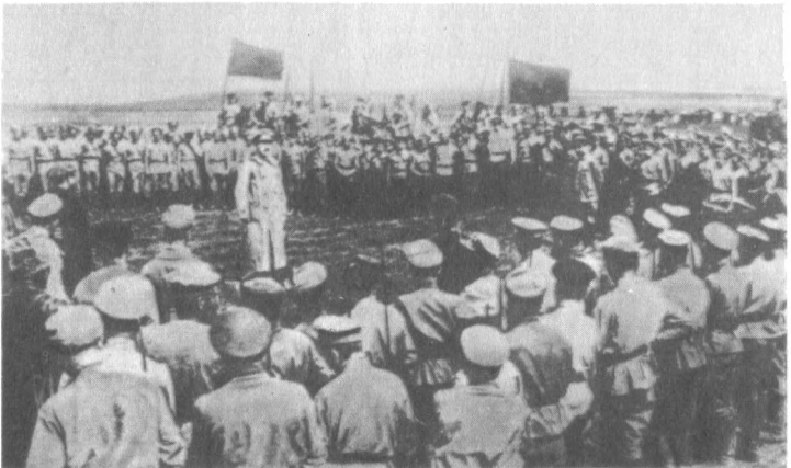
Н. И. Подвойский выступает на красноармейском митинге. Южный фронт. 1918 г.