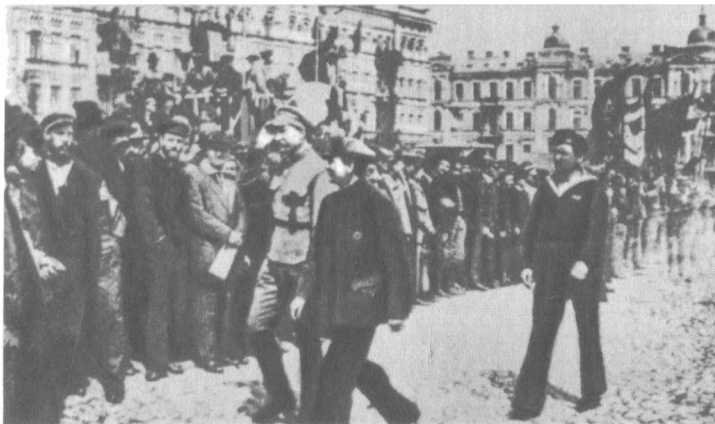
Н. И. Подвойский и А. С. Бубнов в сопровождении матроса Н. И. Приходько. Киев, 1 мая 1919 г.