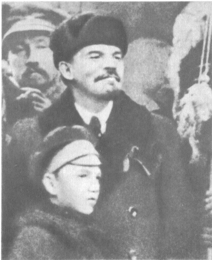
В. И. Ленин и Н. И. Подвойский на Красной площади во время демонстрации трудящихся. 7 ноября 1918 г. Фото. Фрагмент