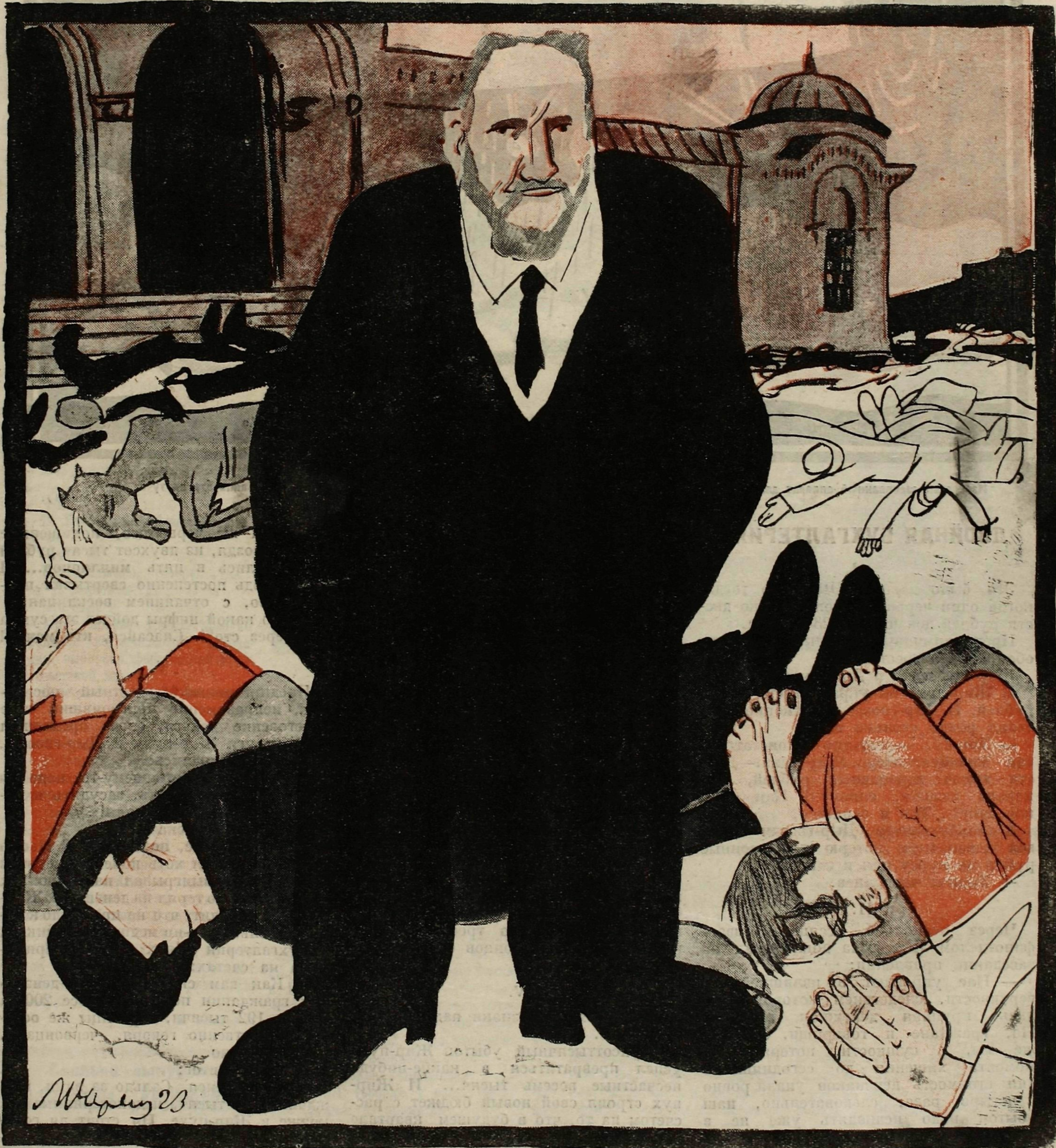
Рис. М. Черемный.