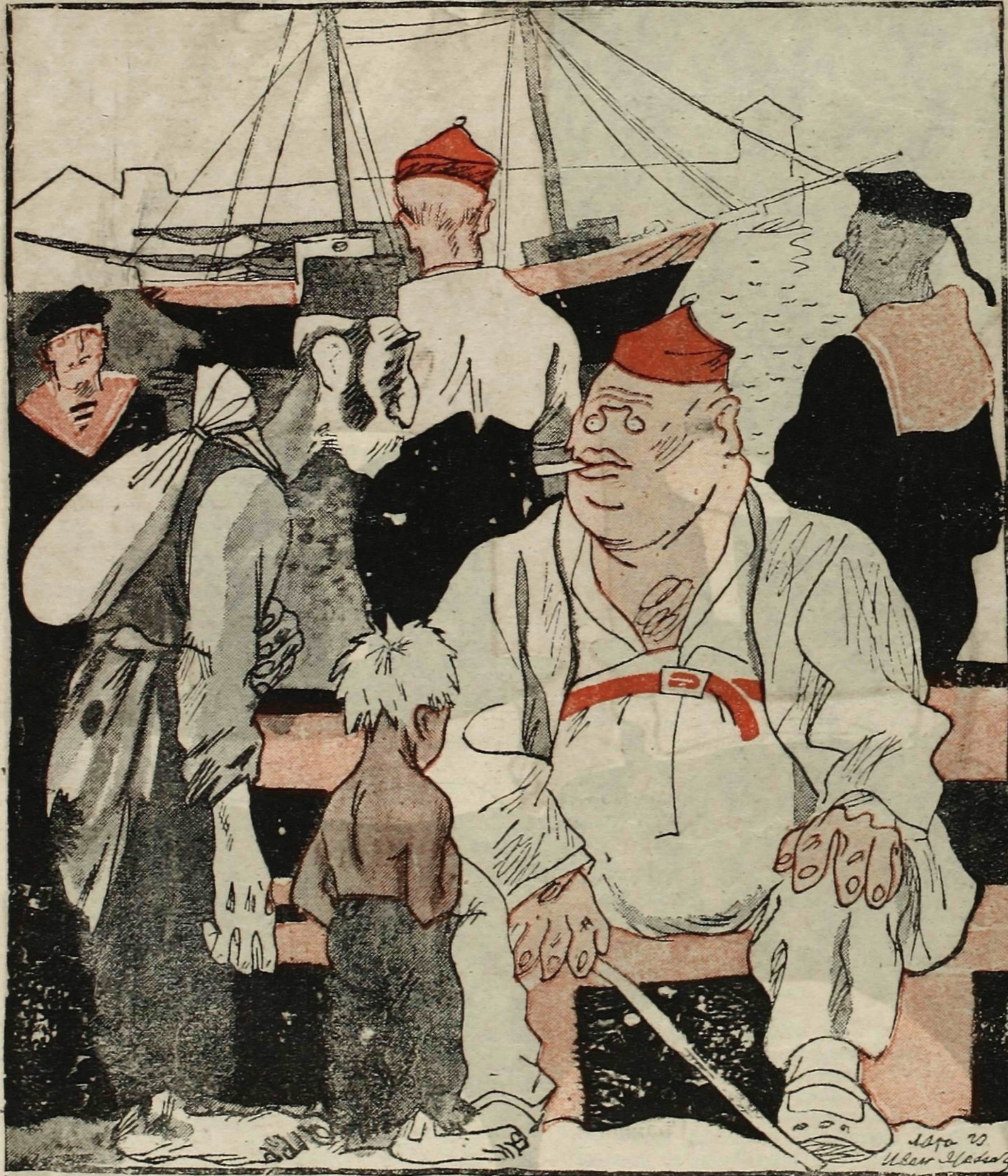
Рис. Ив. Малютина.

НИЩИЙ: — Подайте милостыню. Три дня не ел... НЭПМАН: — Хорошо, пожалуйста. У вас найдется сдачи с пяти червонцев?