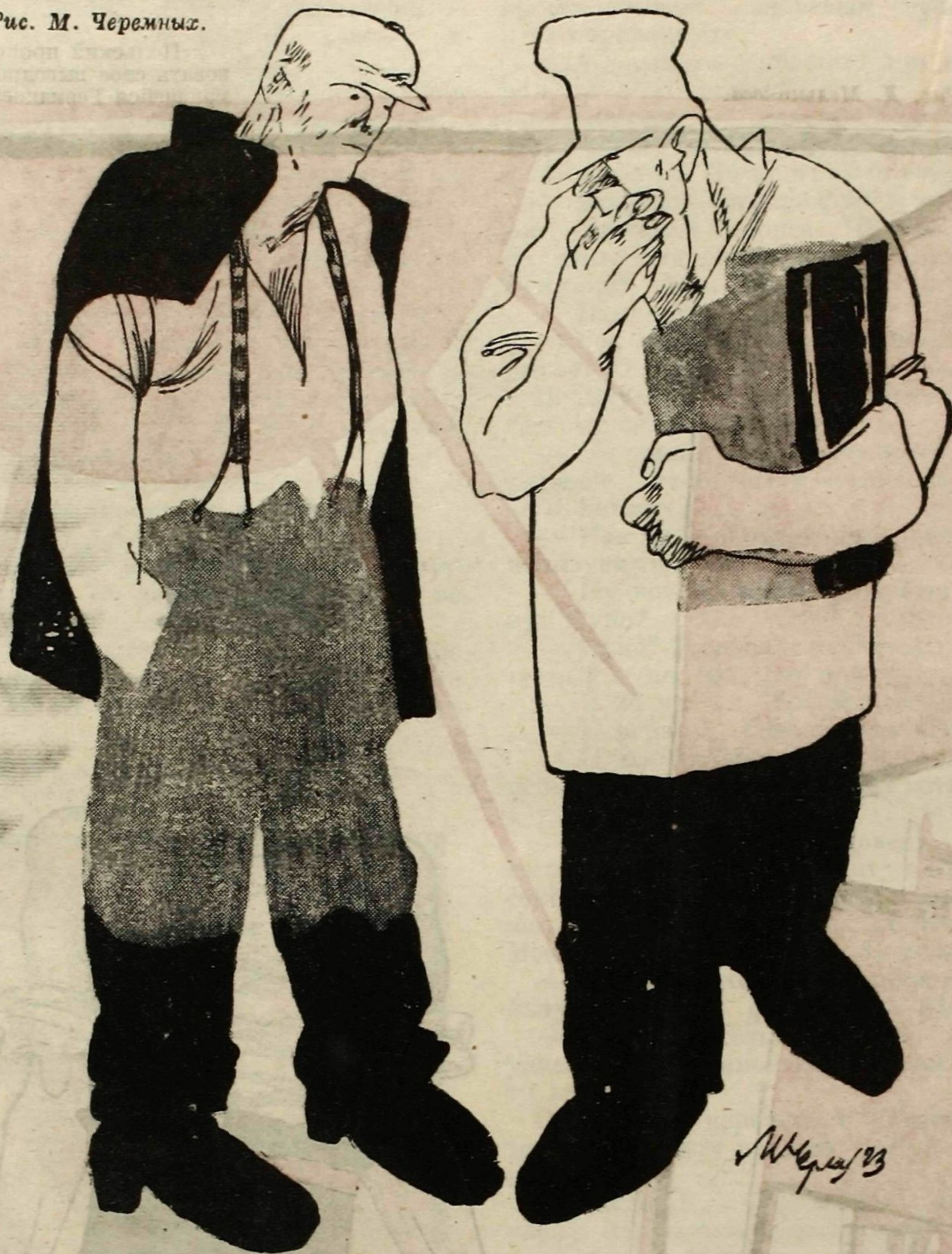
Рис. М. Черемных.

РУССКИЙ РАБОЧИЙ: —...А прежде всего займите вокзалы. НЕМЕЦКИЙ РАБОЧИЙ: — Вокзалы? М-да... значит, нужно заранее запастись перонными билетами.