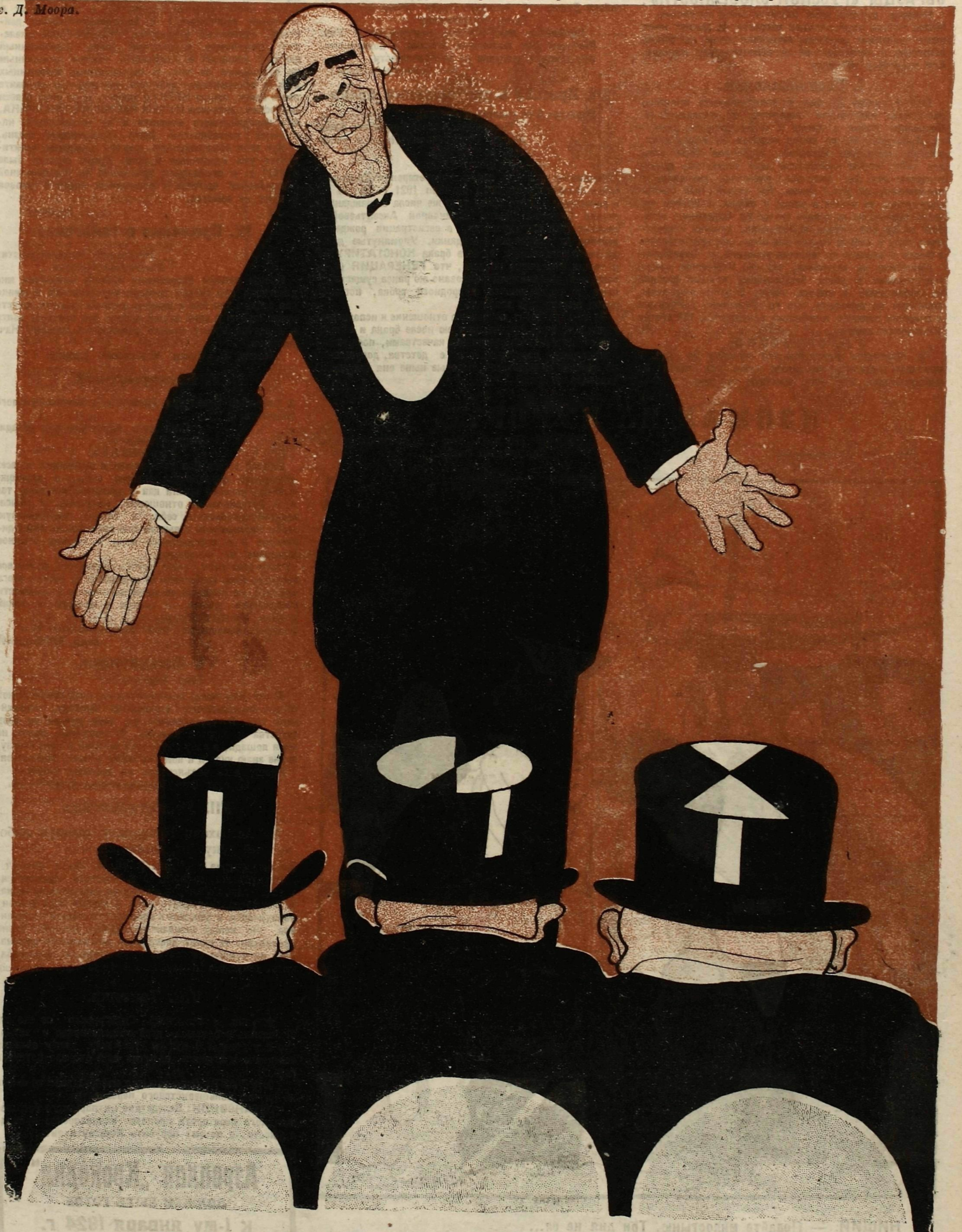
Рис. Д. Моора.

СТАНИСЛАВСКИЙ:—Леди и джентльмены! Как я счастлив, что не вижу перед собой этой советской черни!..