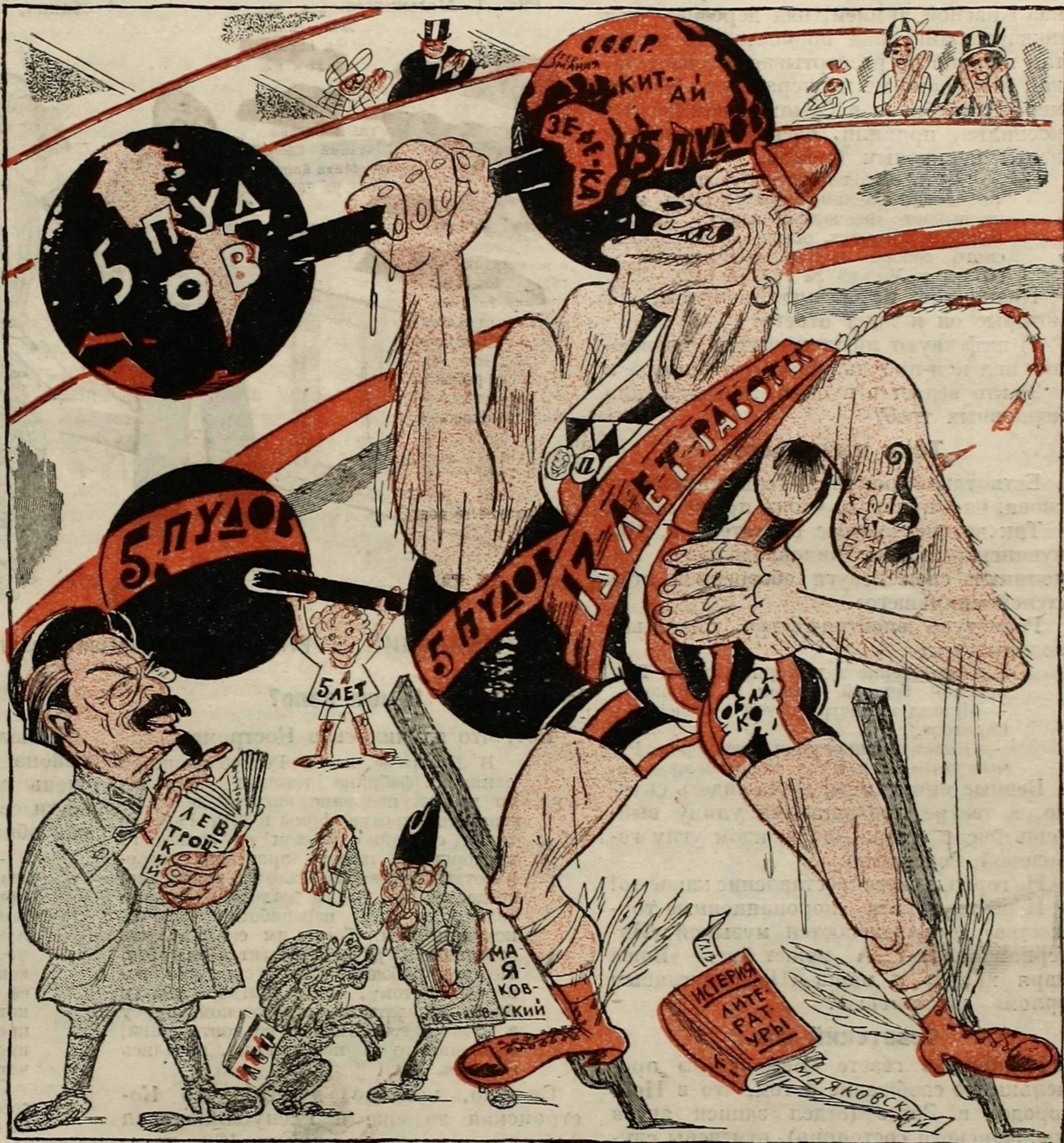
„Маяковский атлетствует на арене слова и иногда делает поистине чудеса, но сплошь и рядом с героическим напряжением подымает заведомо пустые гири.“