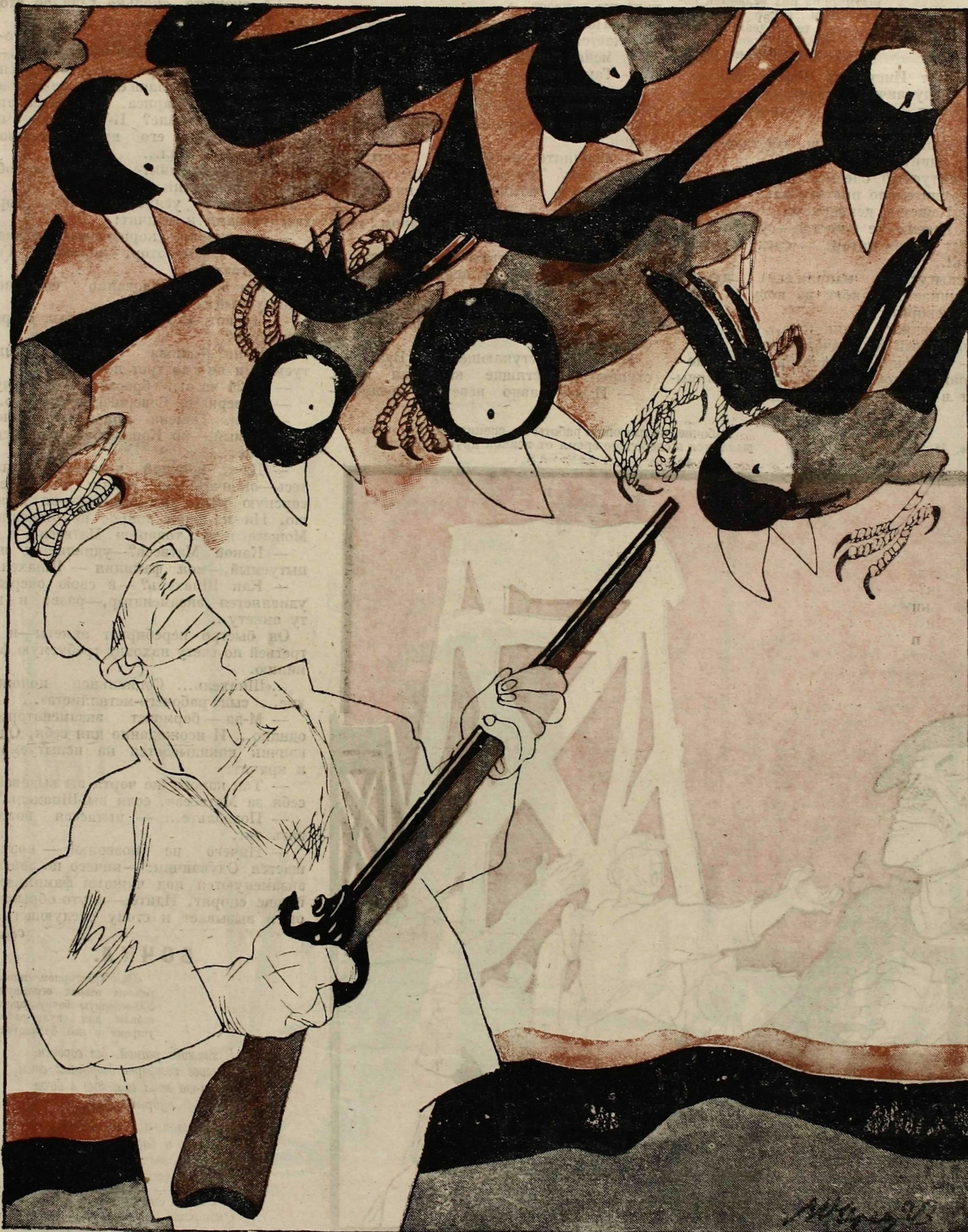
Рис. М. Черемных.