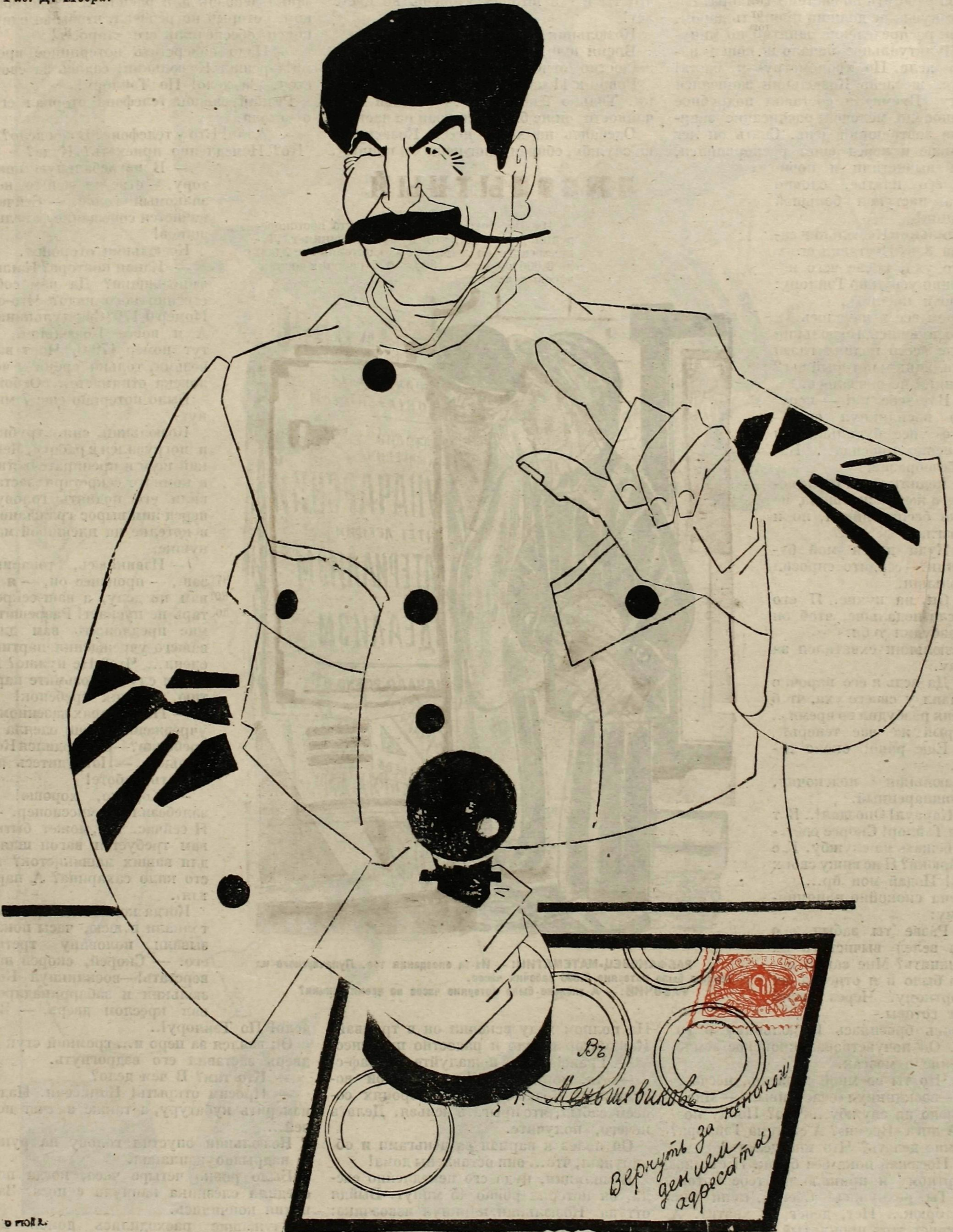
Рис. Д. Моора.

В связи с оживившимися съездами меньшевиков, обсуждающих вопрос о роспуске своей партии, газеты производят анкету: «Какова будет в дальнейшем историческом развитии судьба партии меньшевиков?» (Из газет).