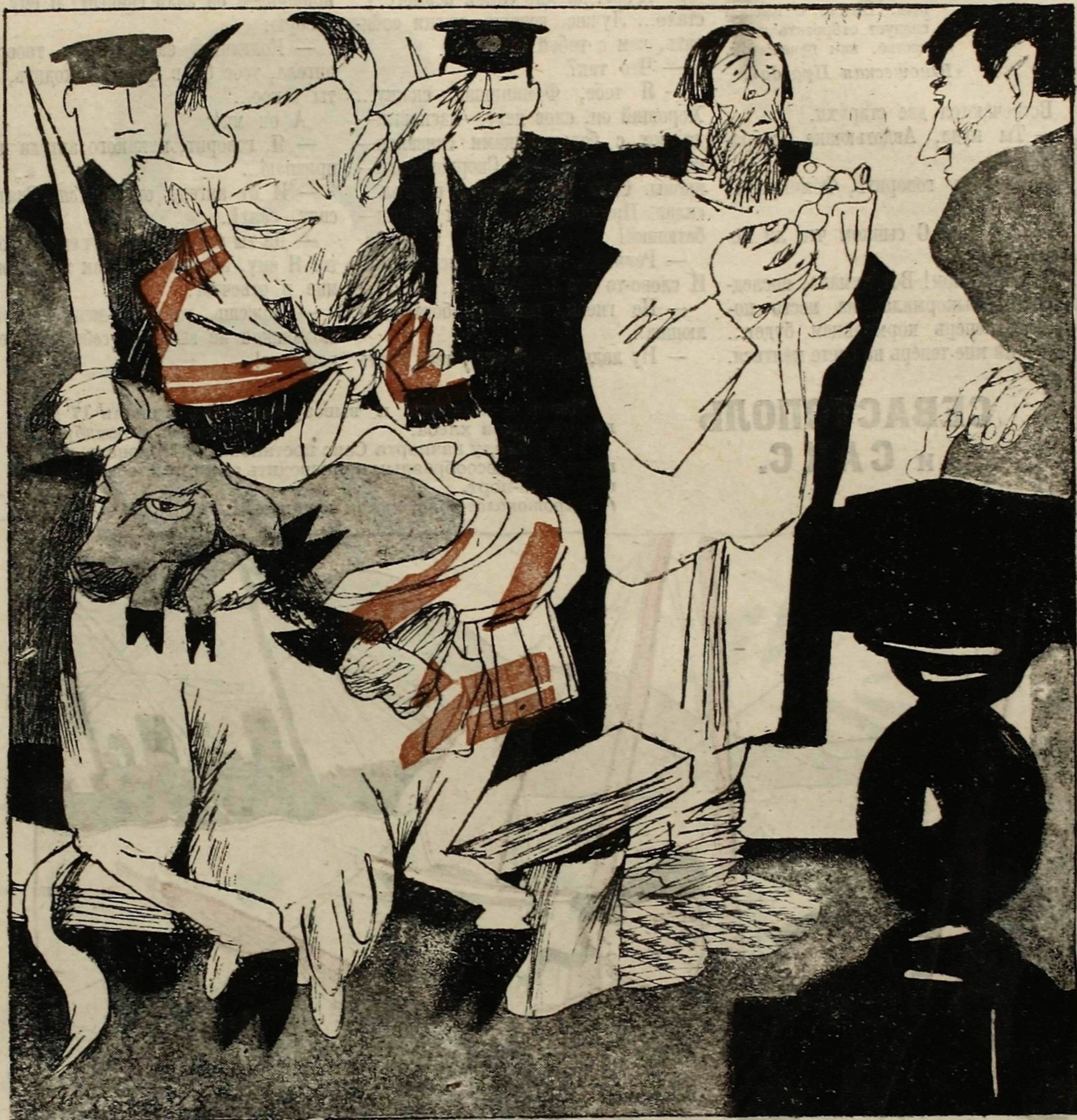
Рис. М. Черемных.

ИЗ ПОСЛЕДНЕГО СЛОВА ПОДСУДИМОЙ КОРОВЫ: — Пожалейте, товарищи судьи!.. Ребенок на руках, муж бежал, хозяин не кормит. Как же я могу молоко давать?