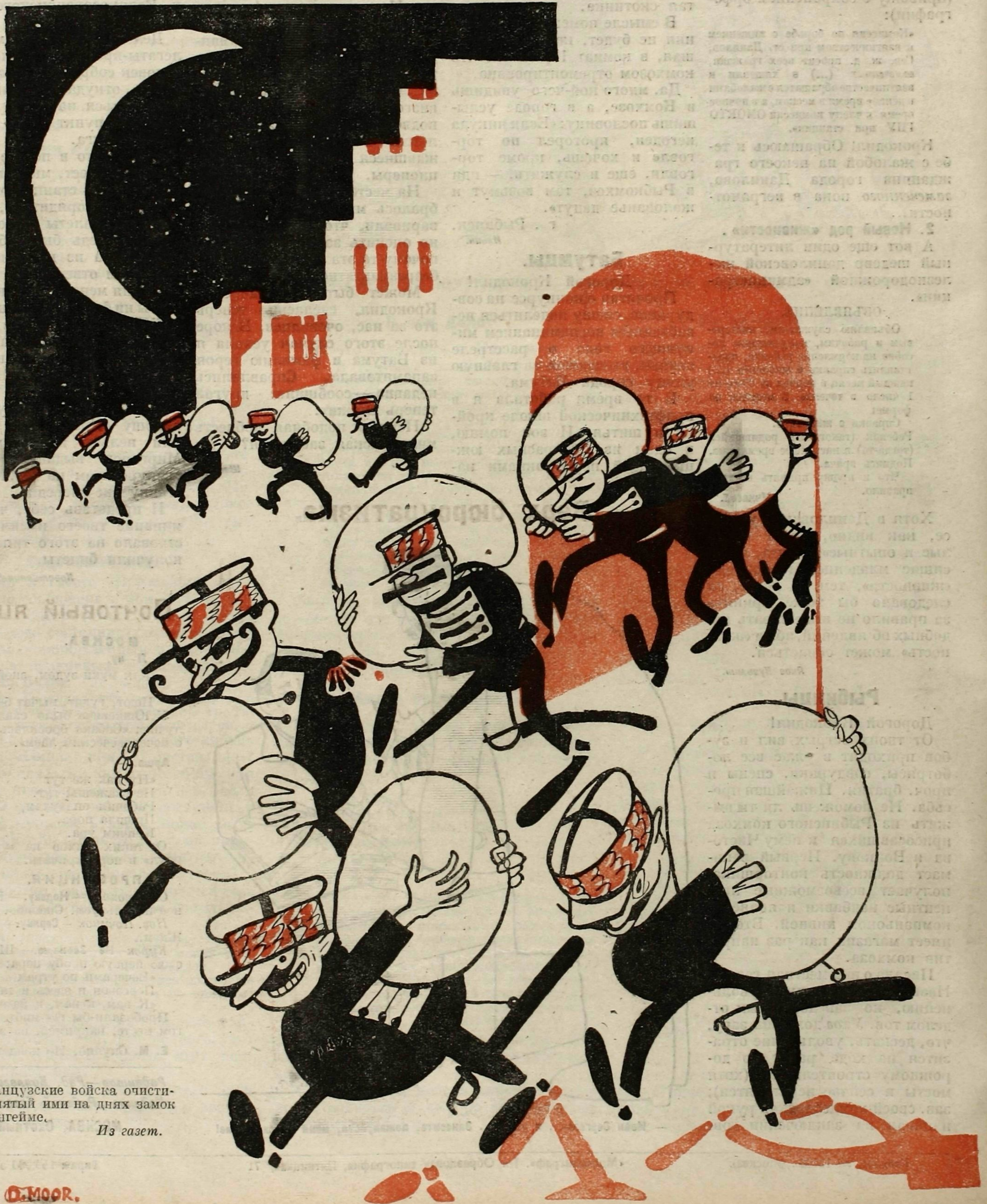
Рис. Д. Моора

Французские войска очистили занятый ими на днях замок в Мангейме.