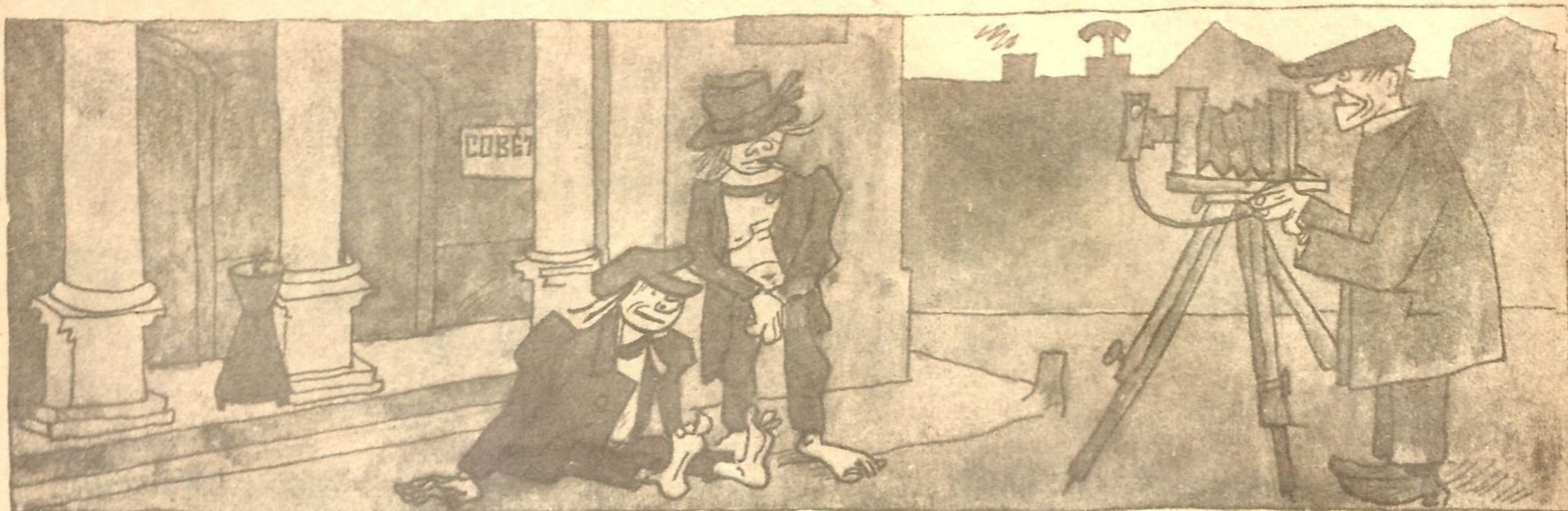
Рис. Ив. Малютина

ФОТОГРАФ: — А ну, ребята, отойдите в сторонку. Здание только-что отремонтировали, а вы на снимке получите вроде пятна на светлом фоне.