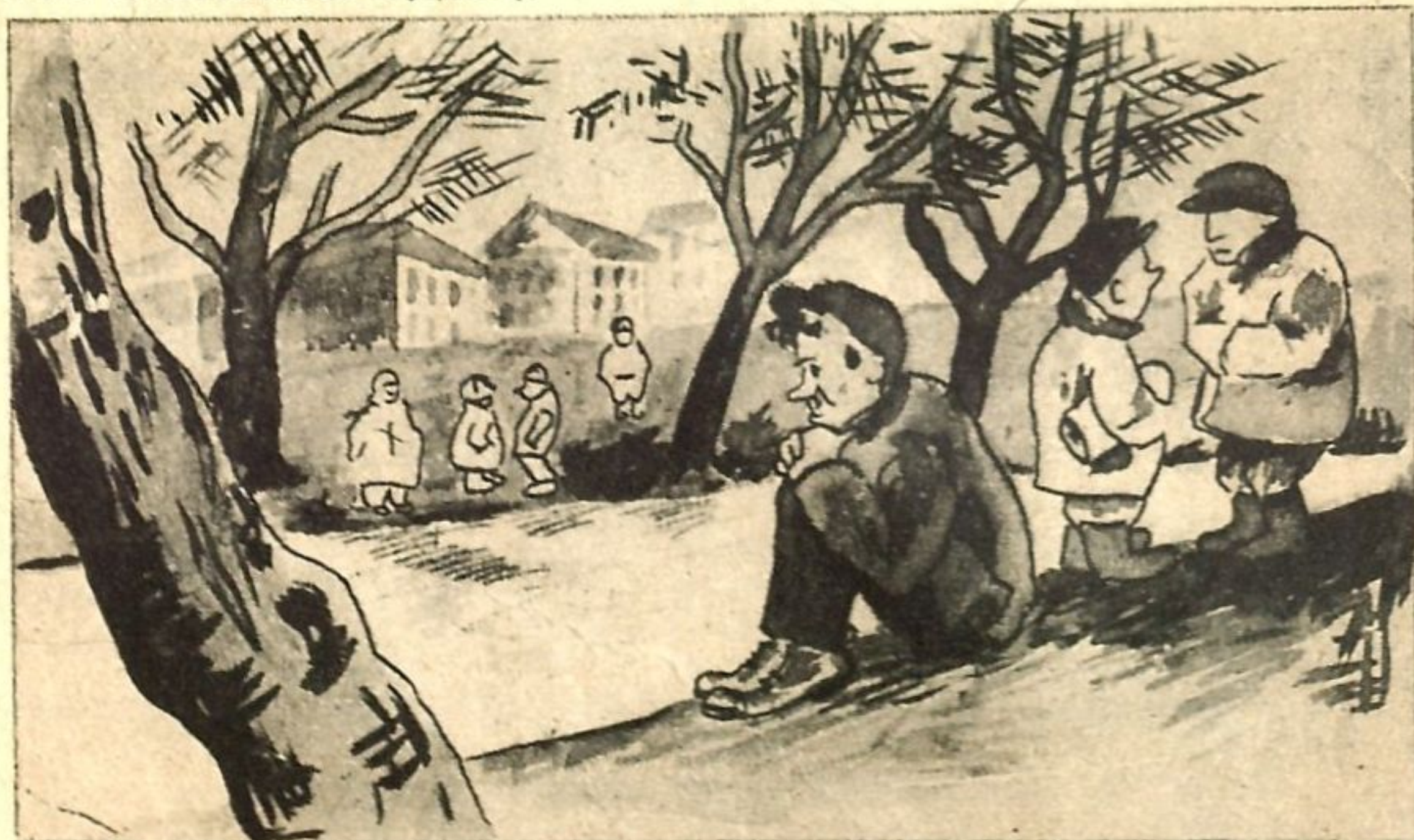
Рис. П. Весеннего (Луганск).

Жители г. Луганска ждут вскрытия реки, т. к. единственная для них баня—река, да и та замерзла.