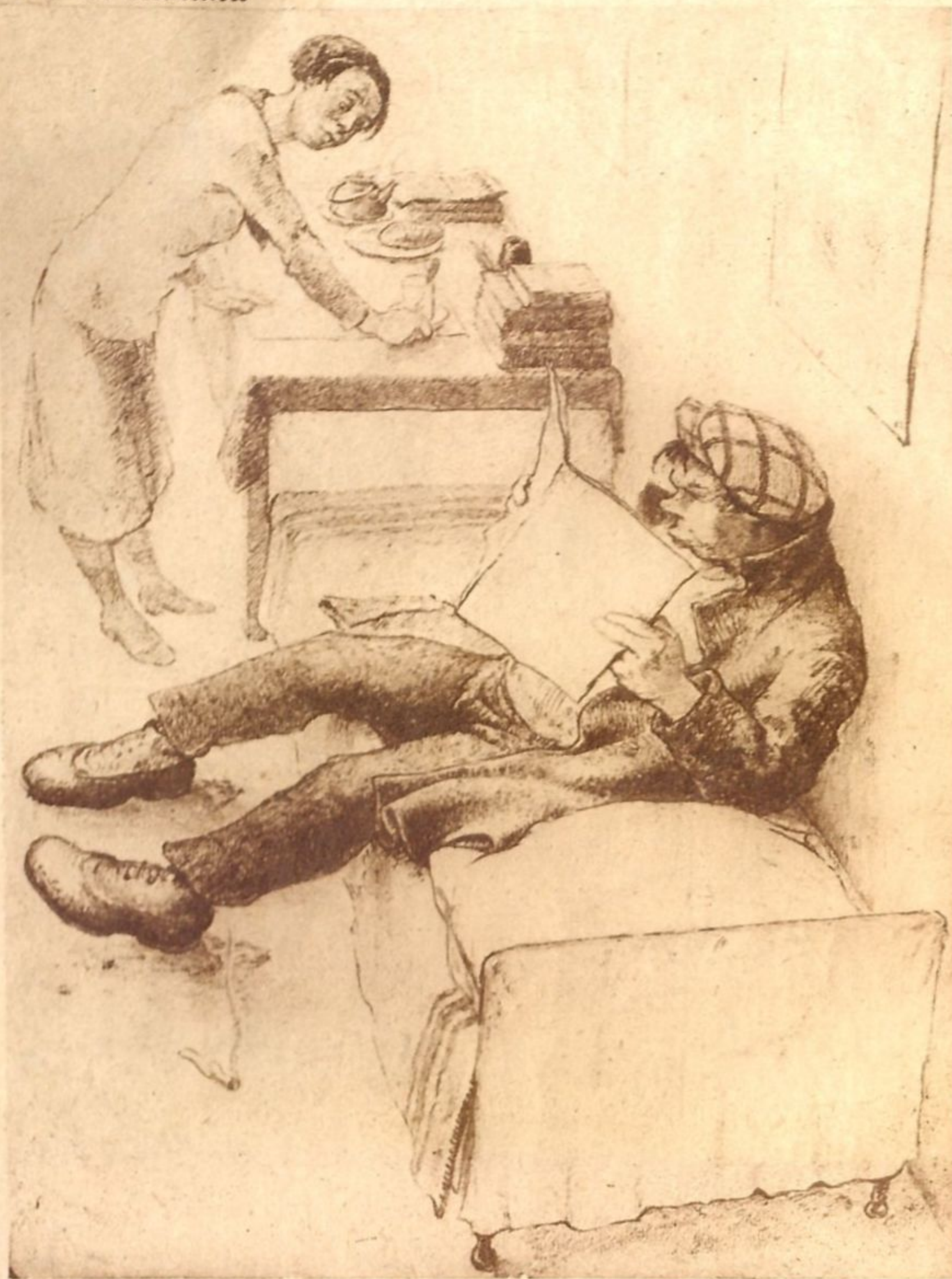
Рис. А. Кикина

— Вот „Крокодил“ тут пишет о неряхах.. Неужели же такие в жизни бывают?