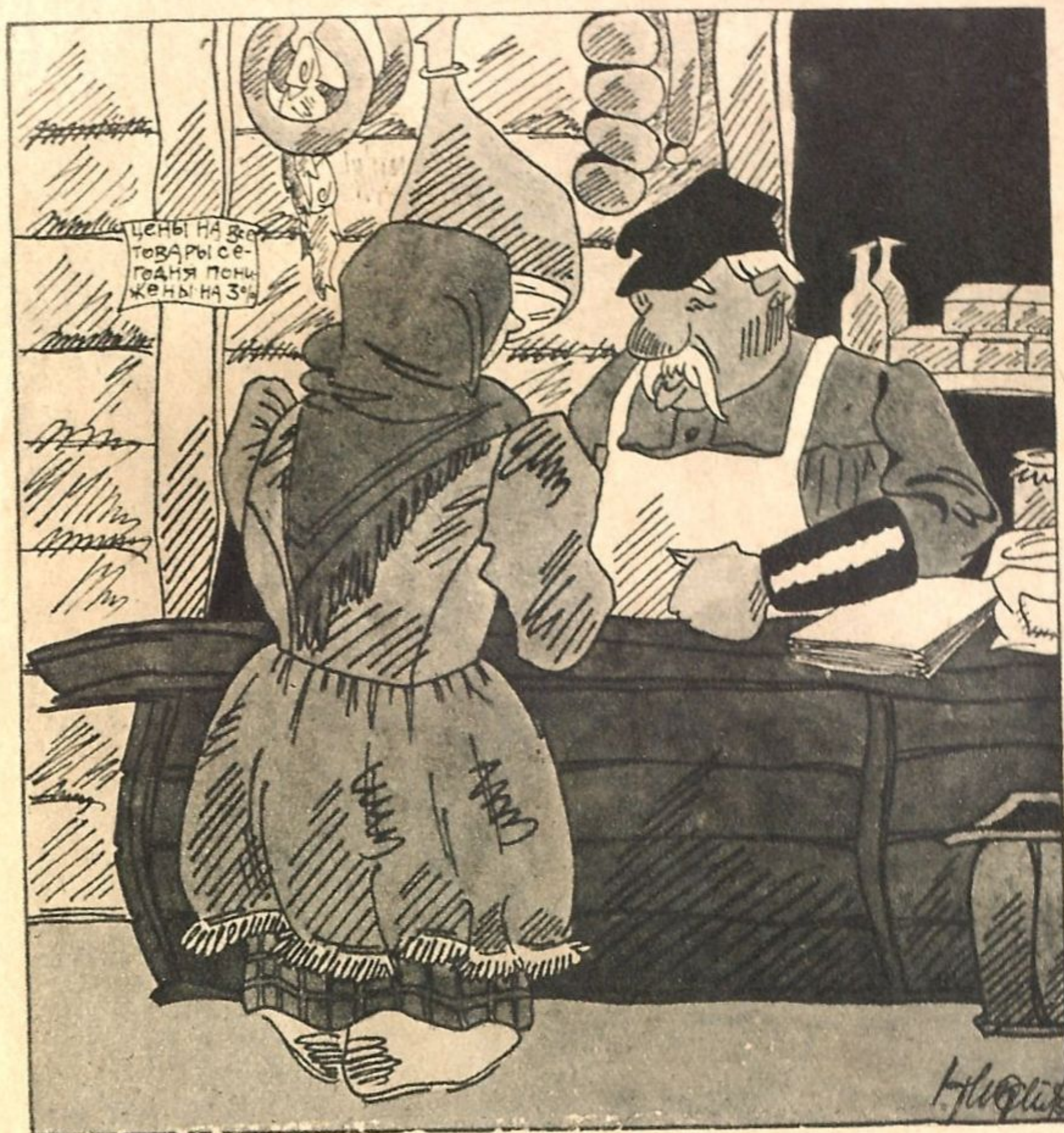
Рис. Н. Стражникова (Москва).

Написано, что цены снижены на 3 процента, а они выше прежнего? — А мы их вчера вечером на 4 процента повысили.