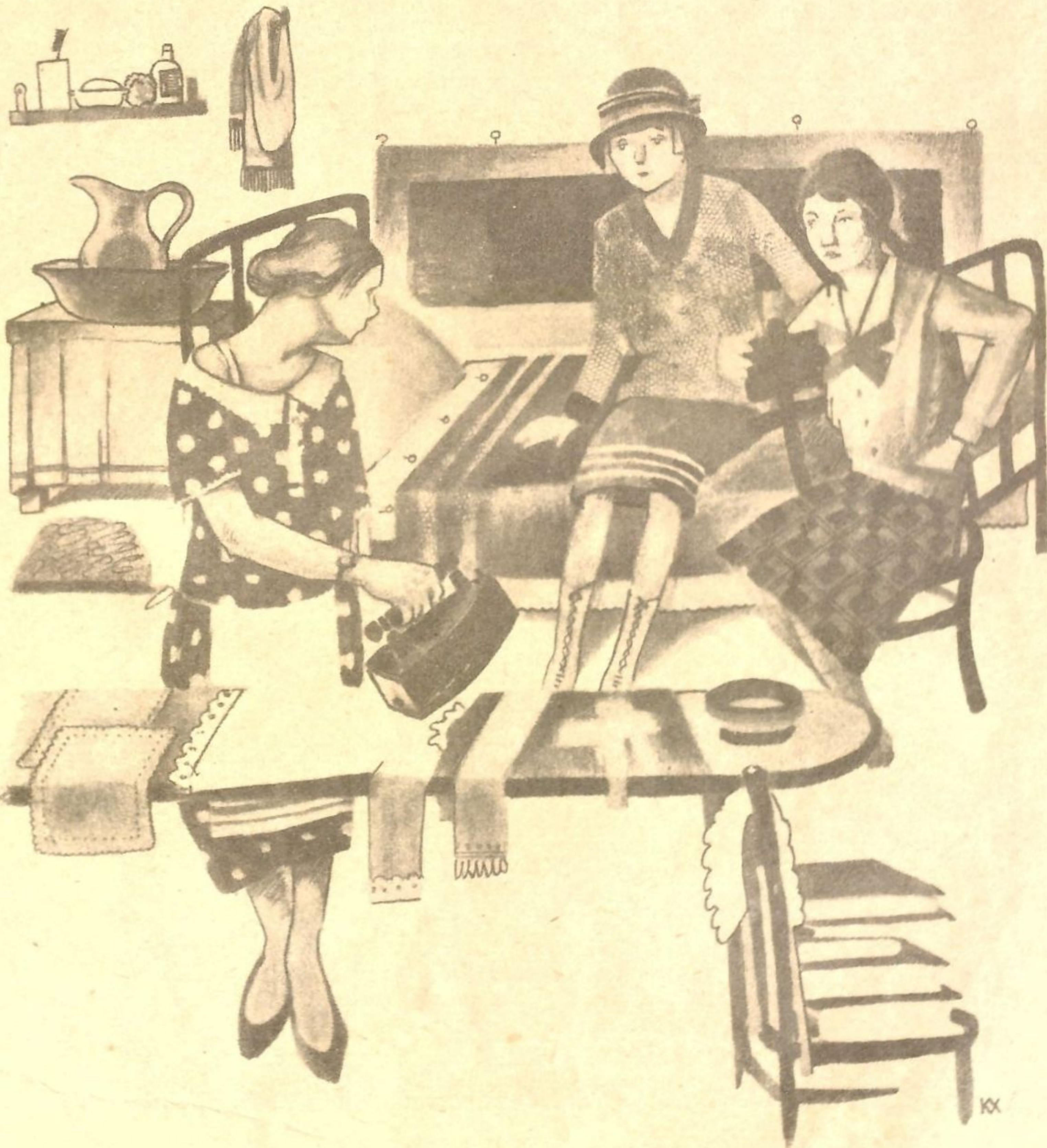
Рис. К. Хомзе