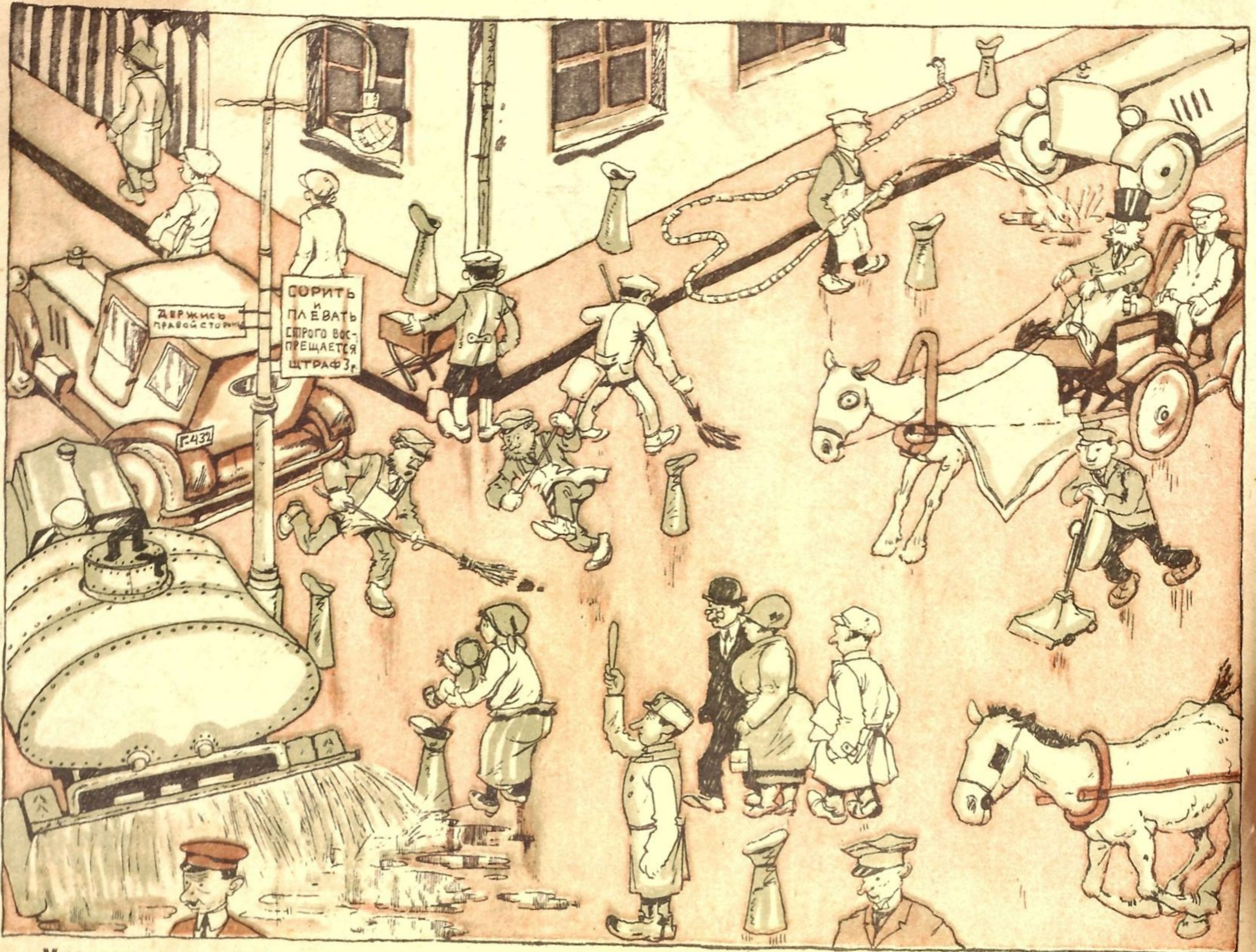
Многие наивные идеалисты полагают, что по выходе номера „Крокодила“ о неряшливости — город Неряшинск примет вот такой вид.