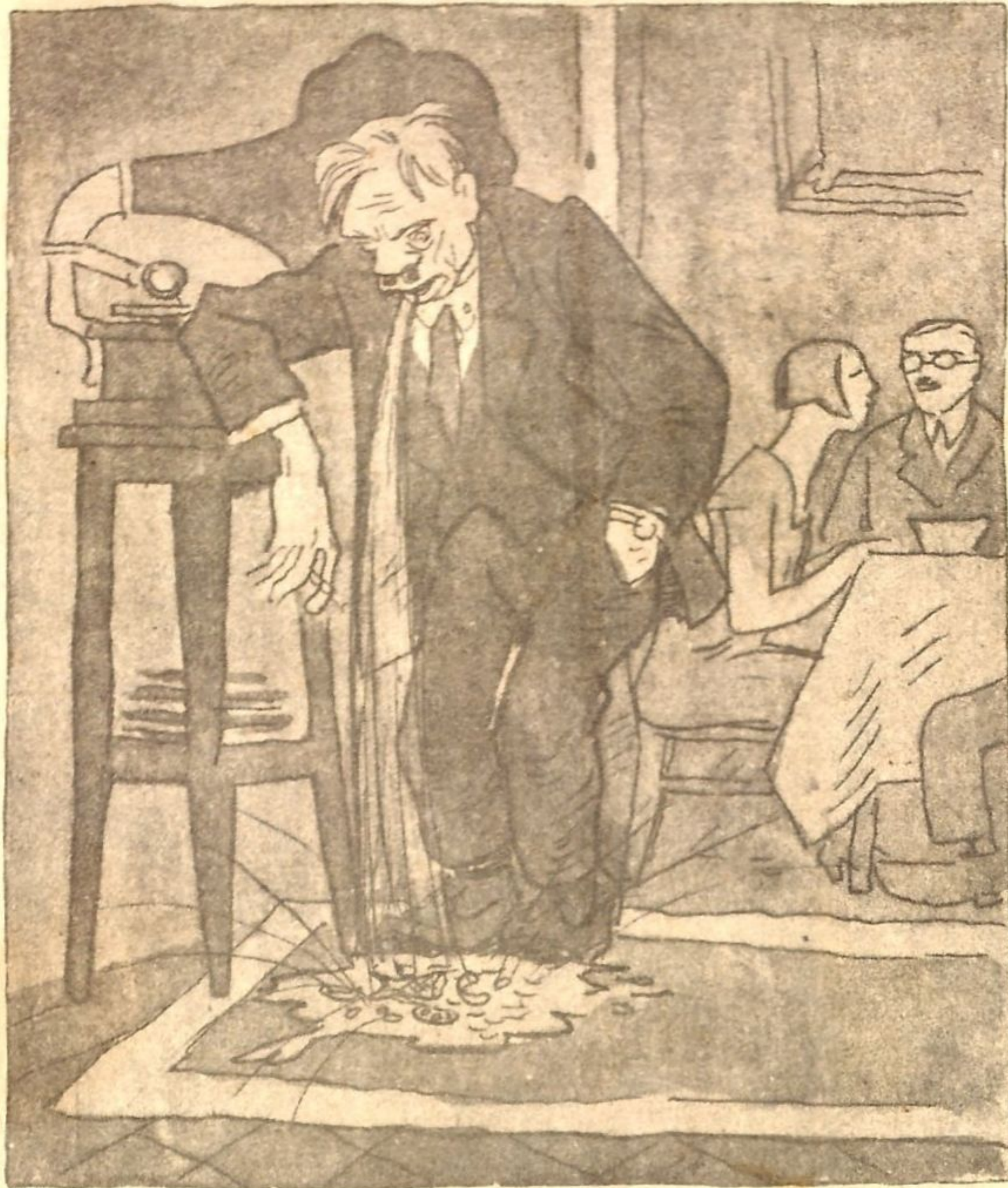
— Другая свинья придет в гости и норовит где-нибудь на скатерть или посреди комнаты... А я свое место знаю — всегда в уголок.