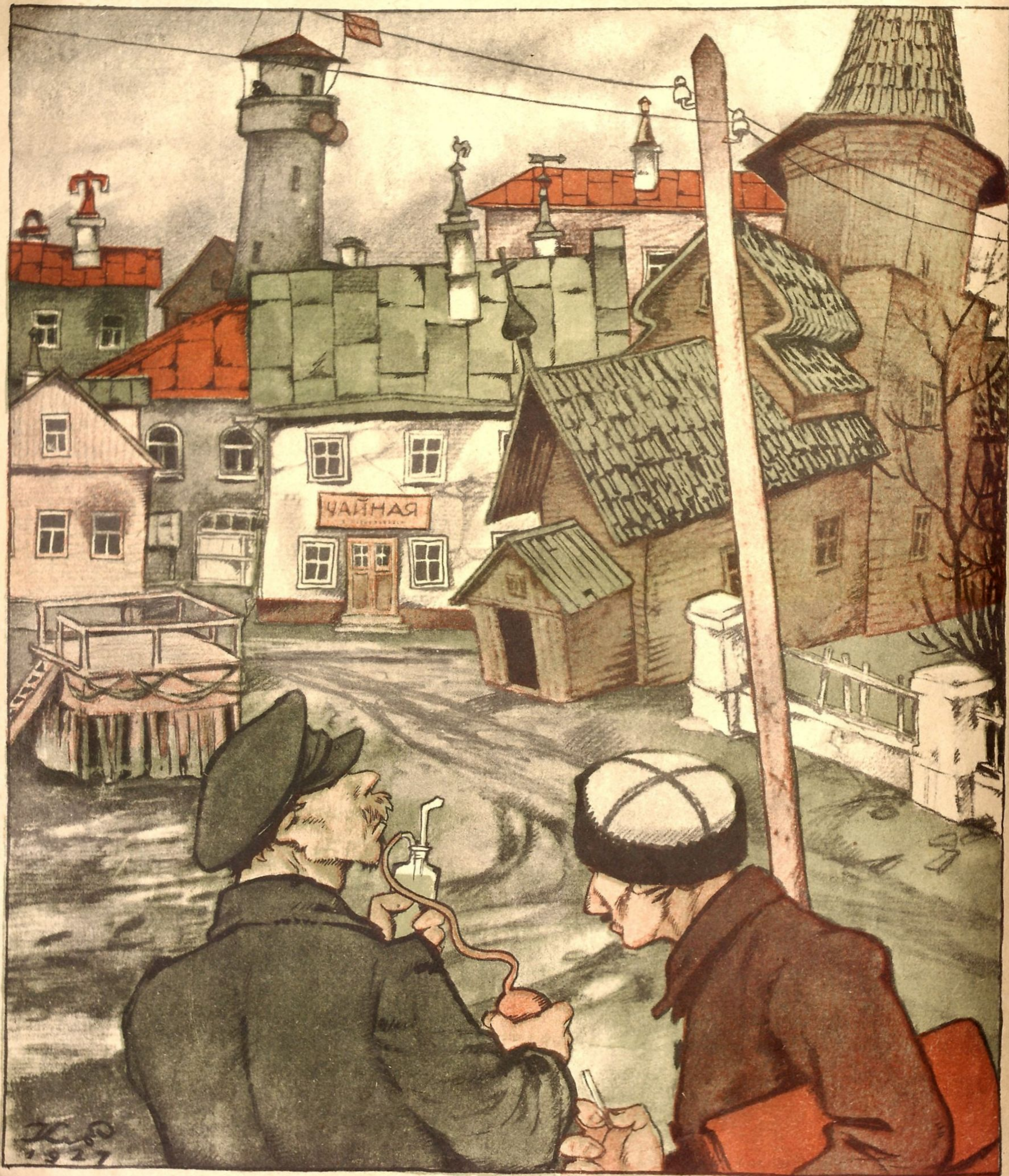
Рис. К. Елисева

— Какая неряшливость! Какая здесь грязь, какой ужасный воздух! Вы председатель санитарной комиссии? Чего же вы смотрите?!