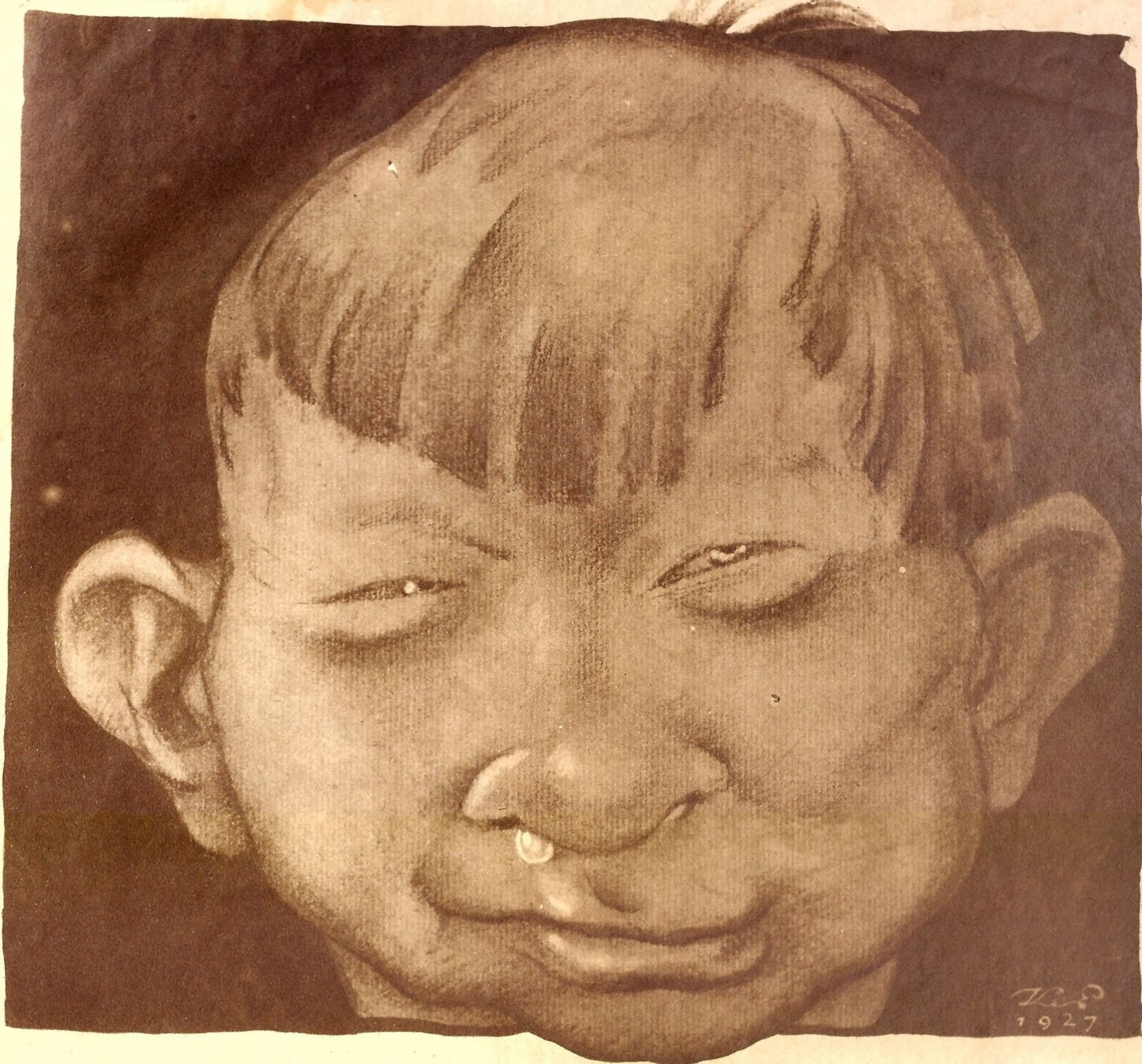
Рис. К. Елисеева

— Вот все говорят насчет неряшливости... Учитесь культуре... перенимайте у Европы... А на кой нам Европа? Мы этим Европам завсегда нос утереть можем!