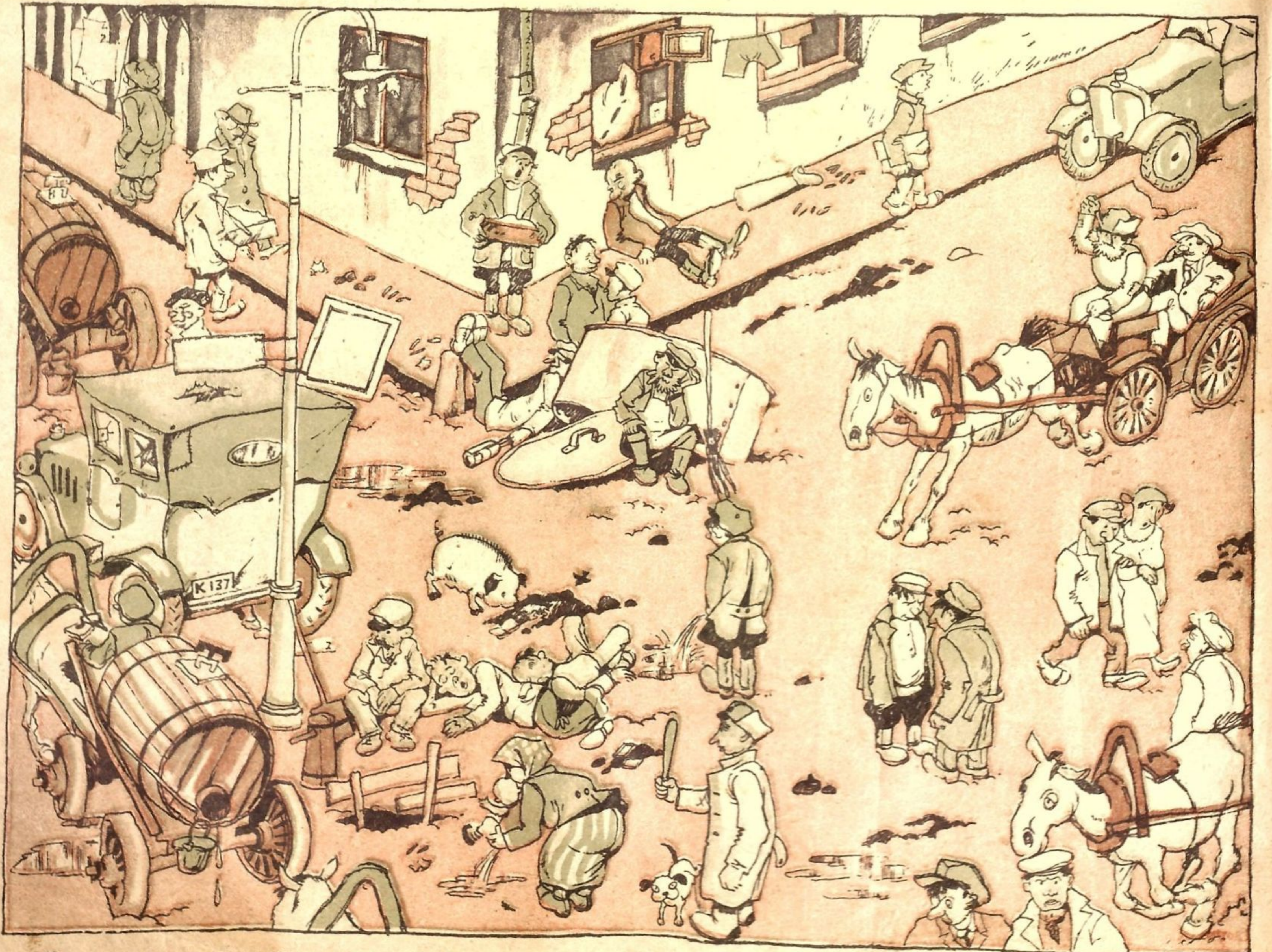
Но, дорогие товарищи, в лучшем случае он исправится только в такой степени.