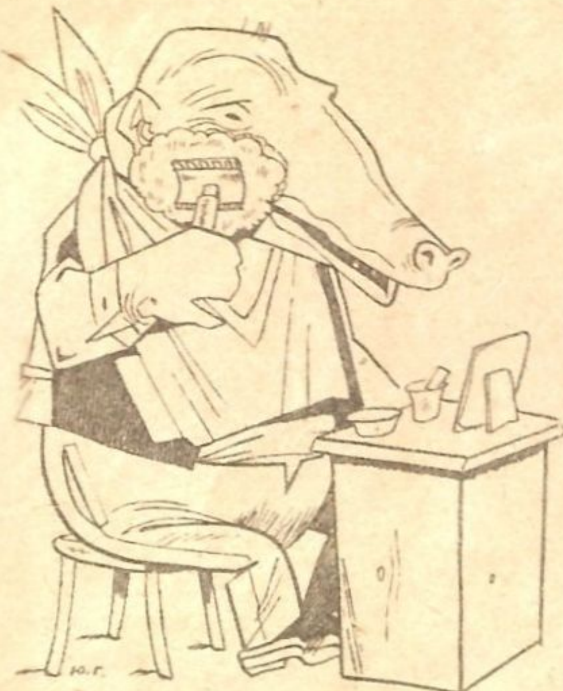
Рис. Ю. Г.

— Я нашел у тебя в левом кармане френча великую эпоху.