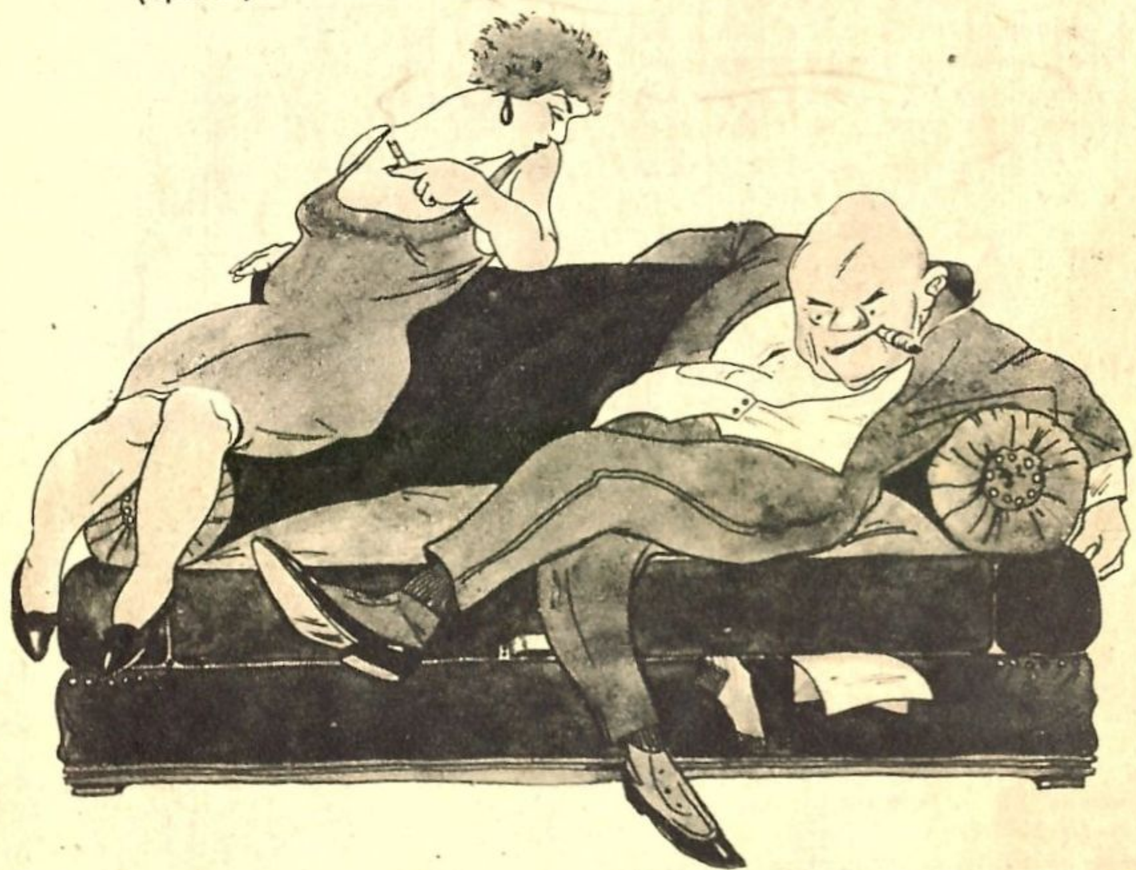
Рис. Е. Рутковского (Брянск).

— Где ты был во время февральской революции? — В этой же комнате, внутри этого же дивана.