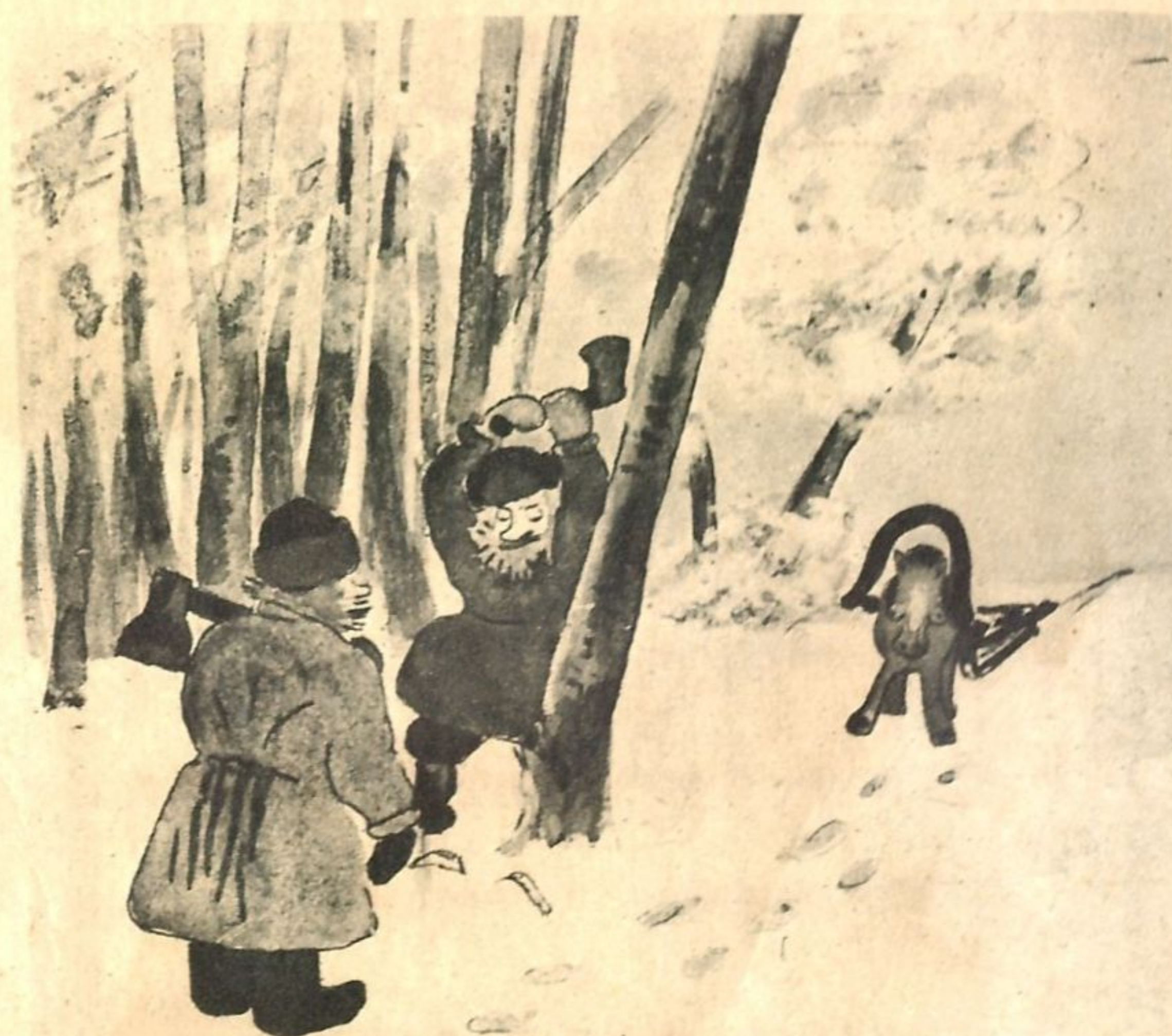
Рис. П. Весеннего (Луганск).

— Не поехал бы рубить, да хорошее дерево жалко—стоит без хозяина!