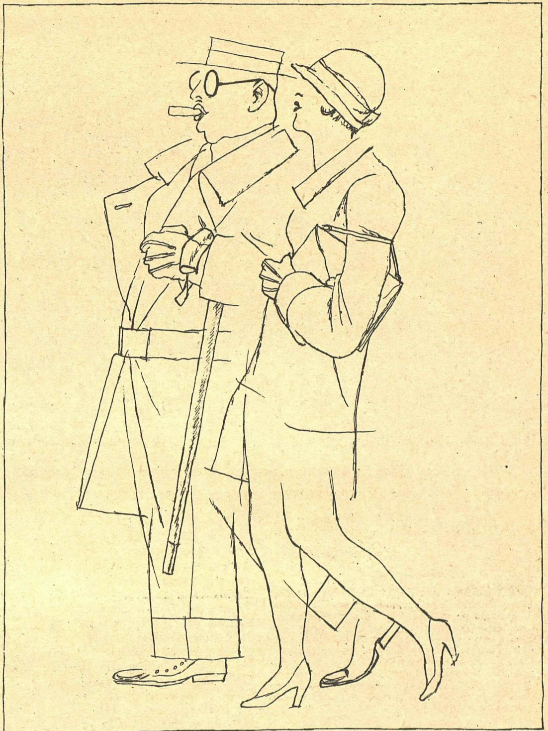
Рис. М. Ч.

— РКИ установила, что в нашем рабочем жилкоопе ни одного рабочего нет... — Что ж удивительного? Рабочие уже ушли: постройка закончена.