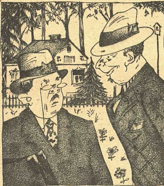
Рис. М. Бабиченко