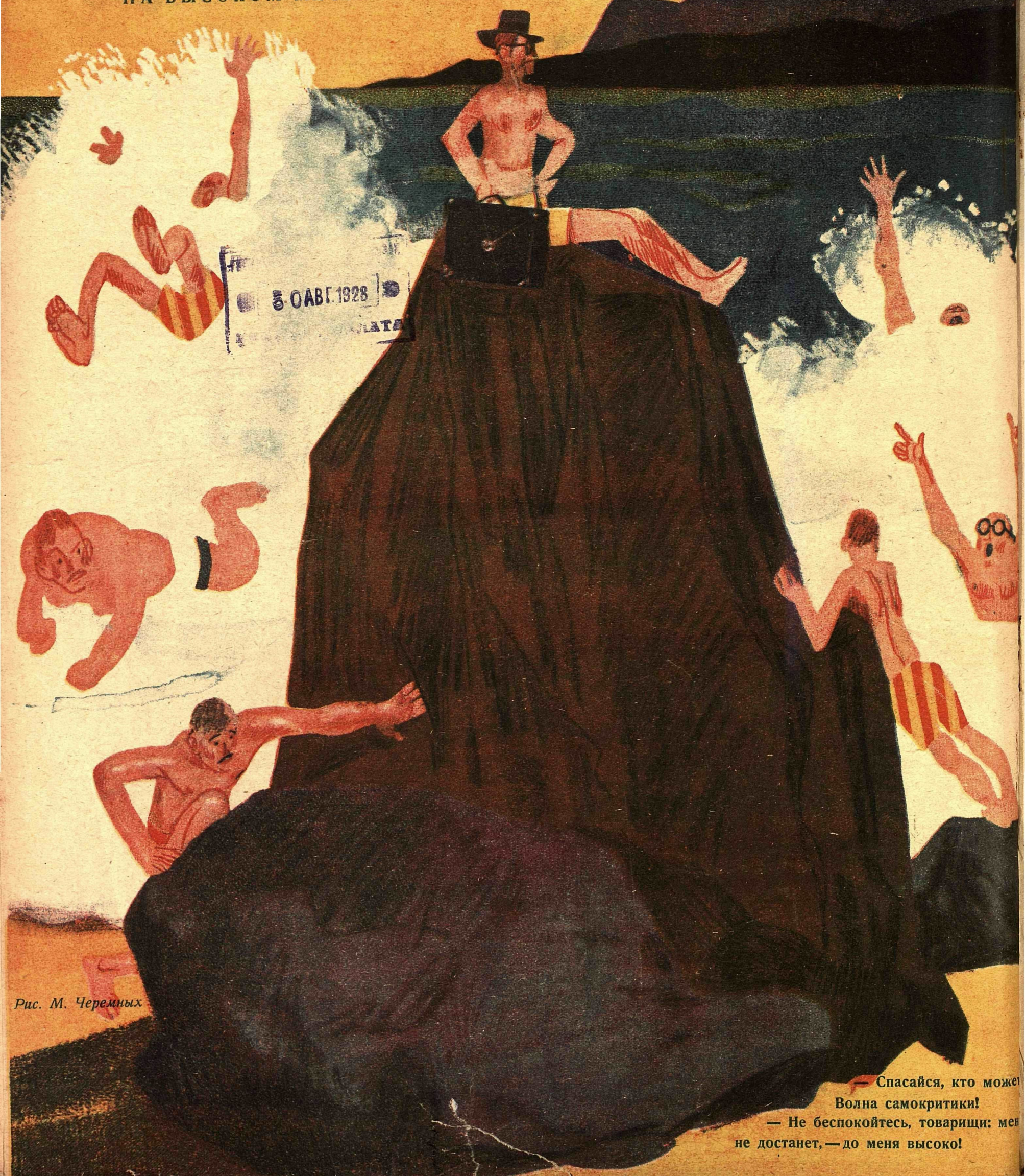
Рис. М. Черемных

— Спасайся, кто может Волна самокритики! — Не беспокойтесь, товарищи: меня не достанет, — до меня высоко!