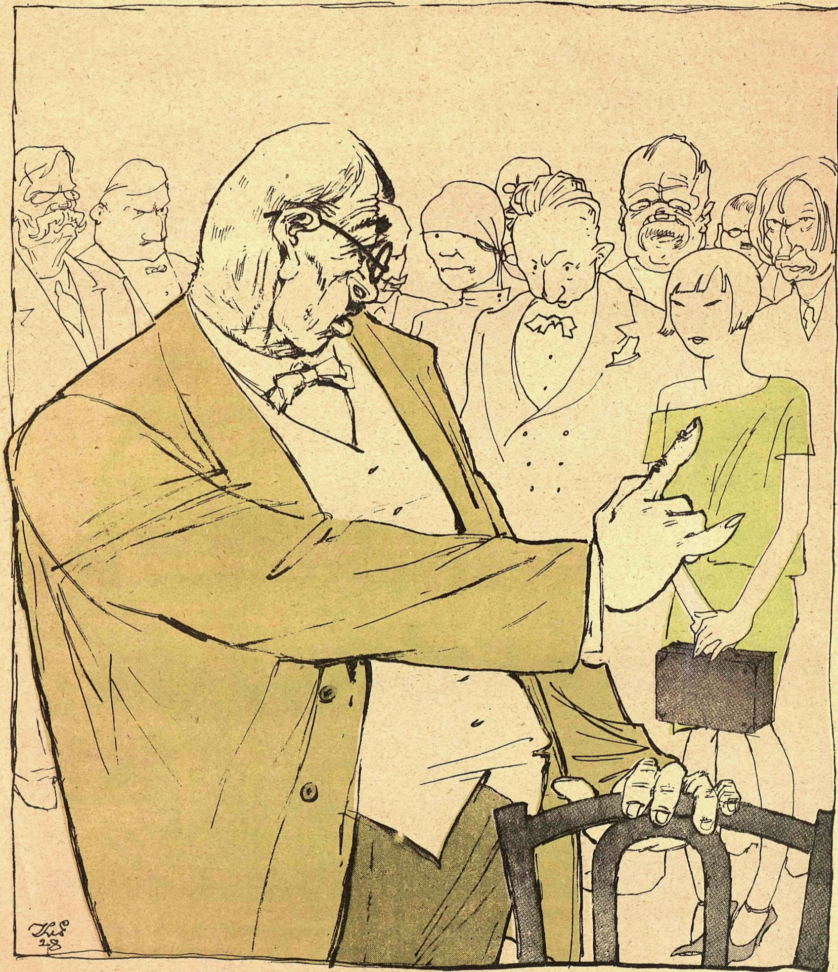
Рис. К. Елисева