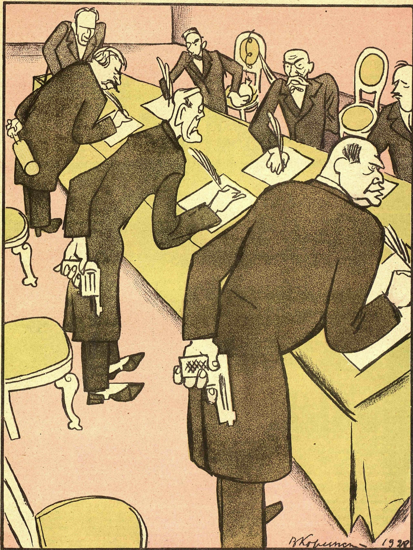
Рис. В. Козлинского