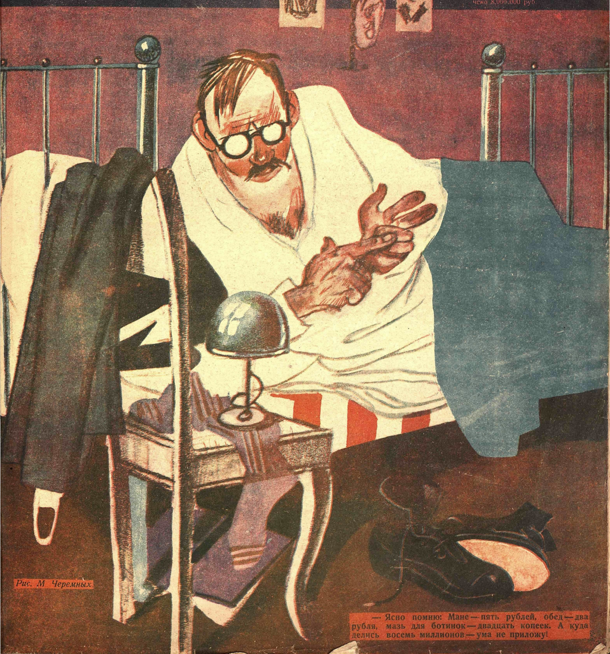
Рис. М Черемных

При постройке Троицко-Орской ж.д. дор. неизвестно куда истра- чено 8.000.000 руб.