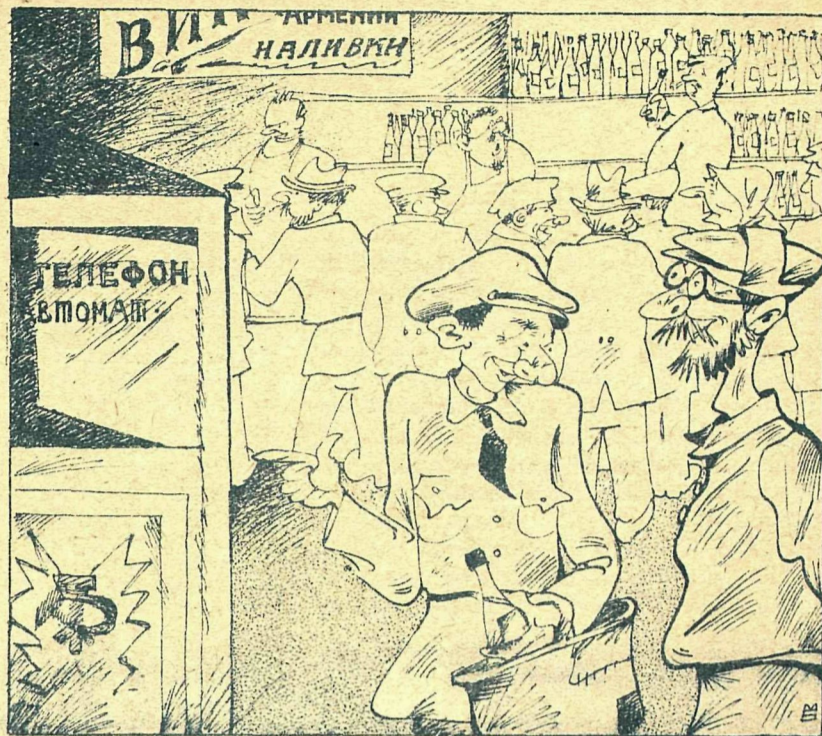
Рис. М. Бабиченко

— Знали, где автомат поставить, — самое посещаемое место выбрали.