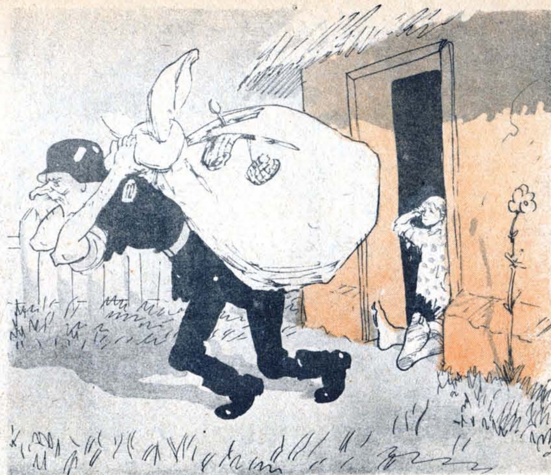
Легко преодолимое препятствие.