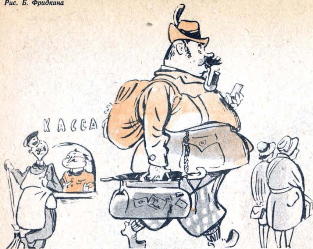
— Вот чудак герр Шнапс! Едет на Украину, а взял билет туда и обратно.