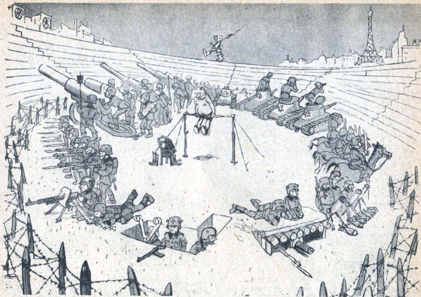
— Приготовились!.. Огонь!.. Ober-лейтенант приступает к упражнениям!

Французские патриоты выгнали на группу германских летчиков, занимавшихся гимнастикой на стадионе Жюль Буэн в Париже.