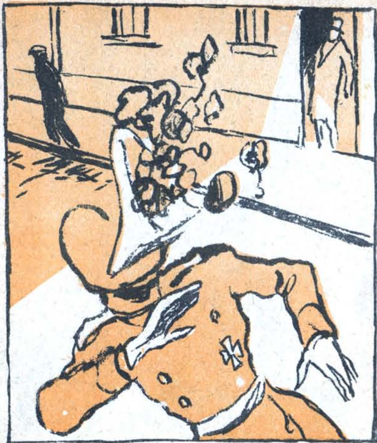
Его мучают головные боли.