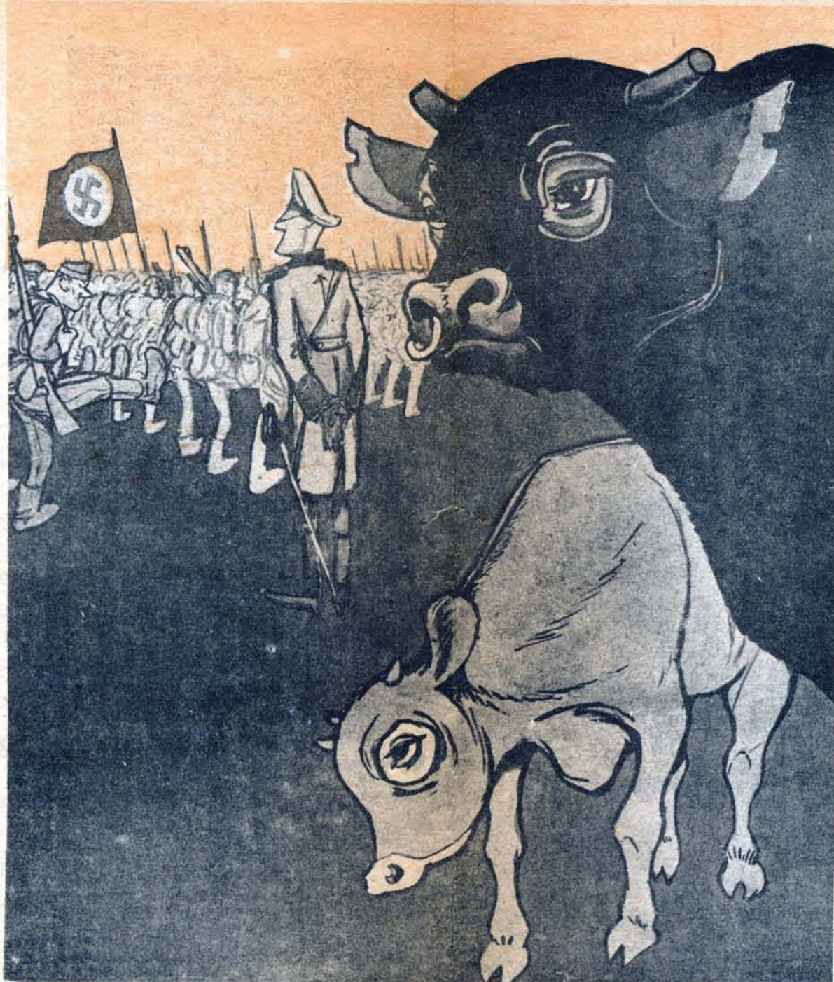
— Посмотри, телушка, а вон там гонят пушечное мясо.