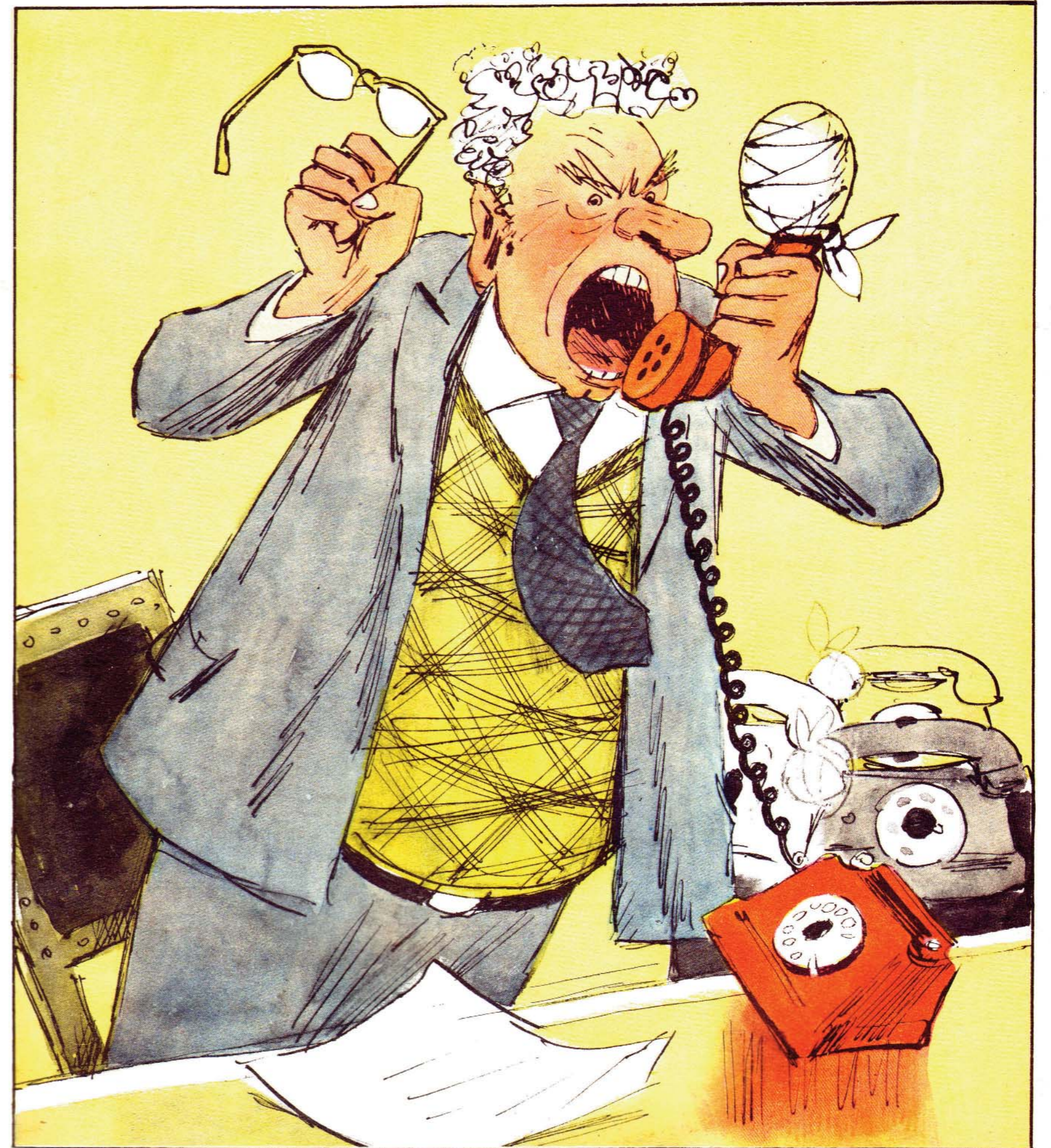
Односторонний метод руководства