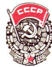
Рисунок Ю. ЧЕРЕПАНОВА