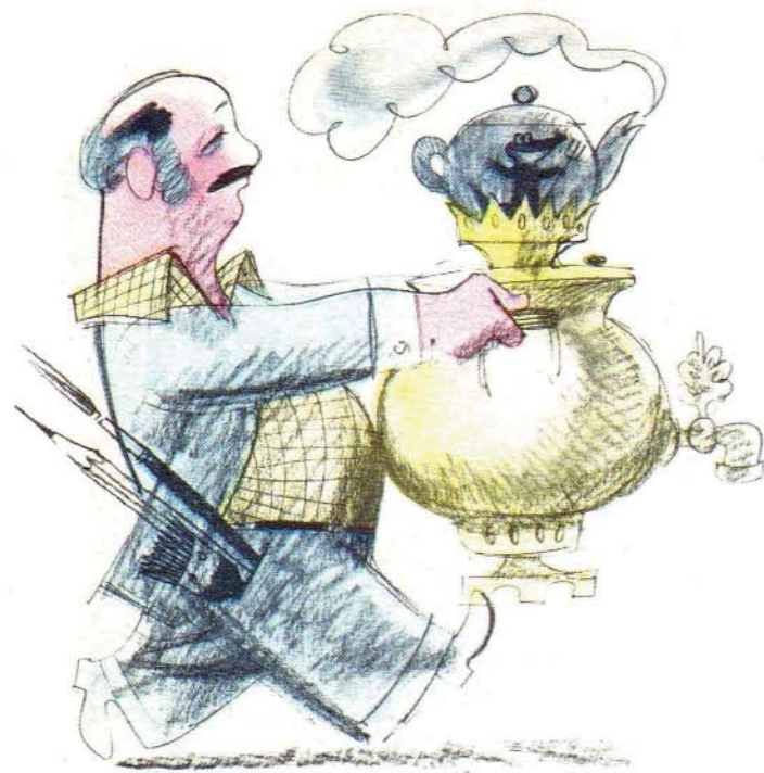
Дружеский шарж В. ЧИЖИКОВА.