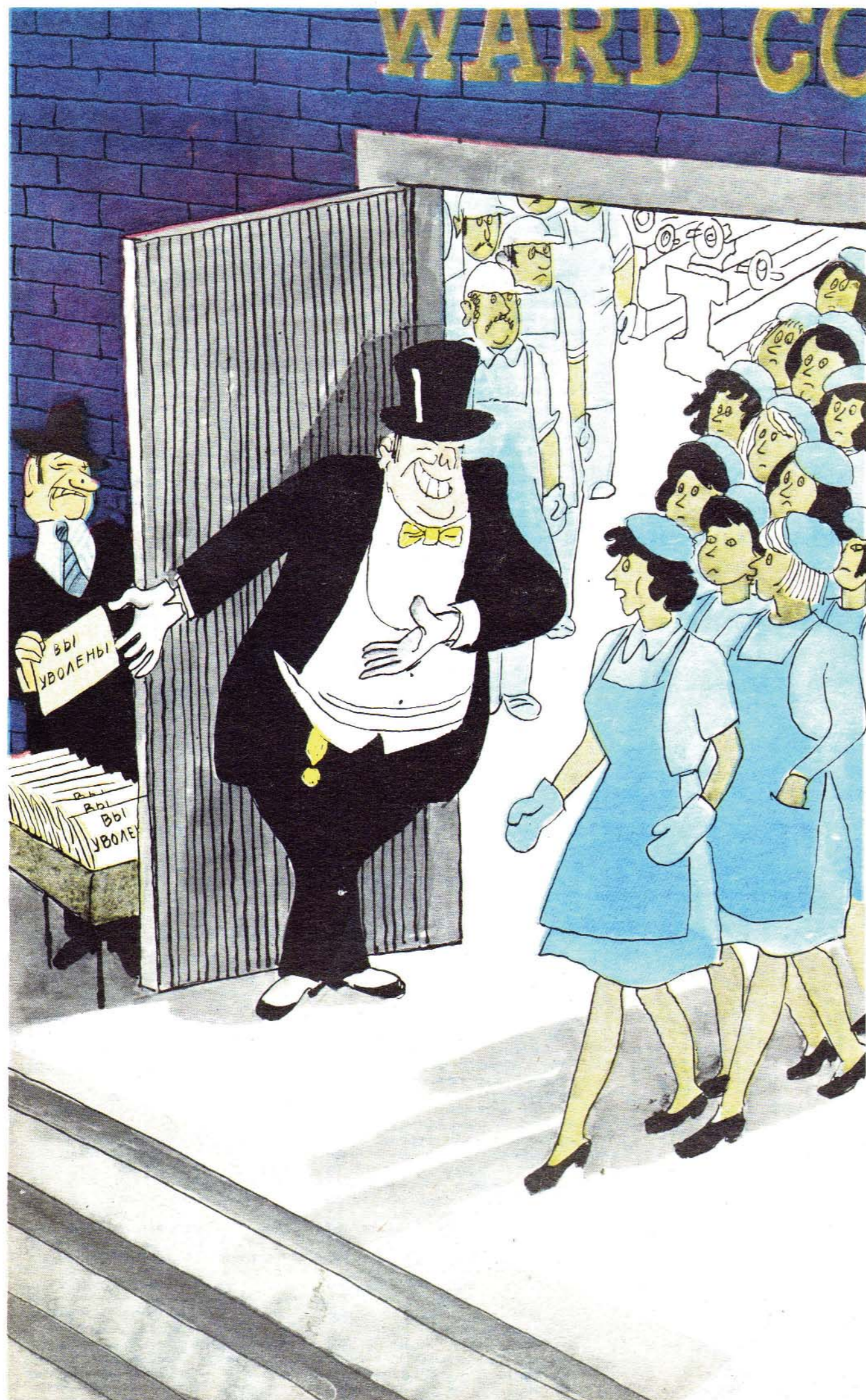
Первыми выходят дамы...