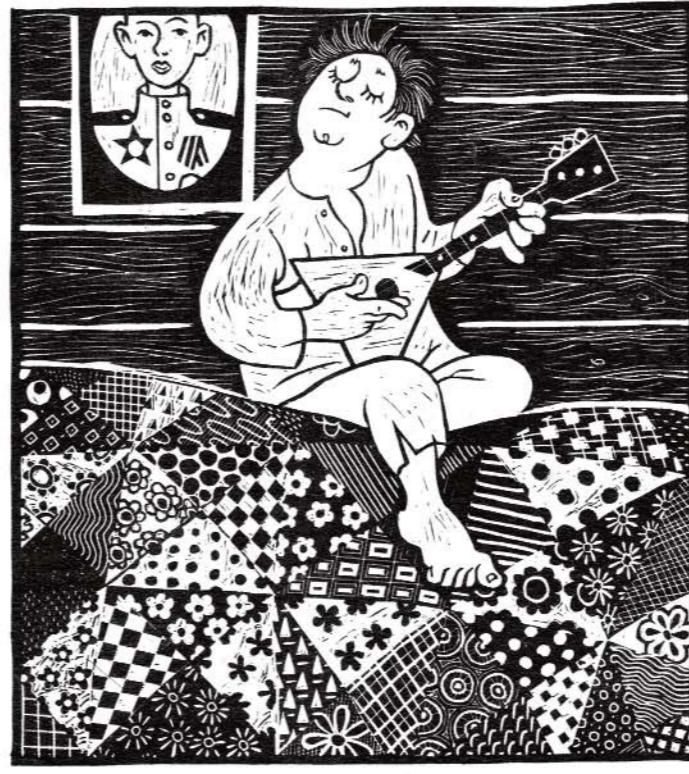
ИГНАТ С БАЛАЛАЙКОЙ