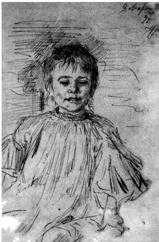
Возвращенный рисунок И.Е. Репина.

Пока удалось вернуть пять документов. Это карандашный автопортрет М.А. Врубеля и четыре рисунка И.Е. Репина. Остальные документы проданы неизвестно кому. По словам лекционера, с помощью которого удалось возвратить архиву эти рисунки, он не знает, где остальные документы.