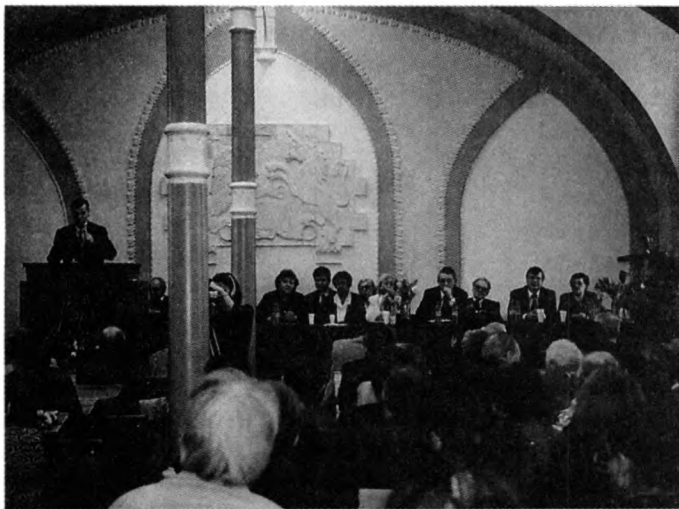
В актовом зале ИАИ РГГУ. Почетный президиум юбилейного совета.