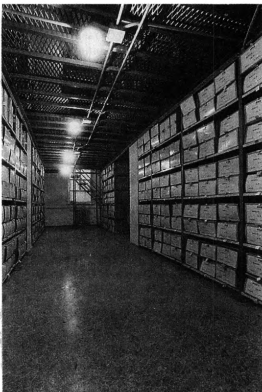
Новое хранилище РГАЭ.

Опыт развития этой работы в федеральных архивах проанализирован и обобщен сотрудниками отдела в специальном ин-