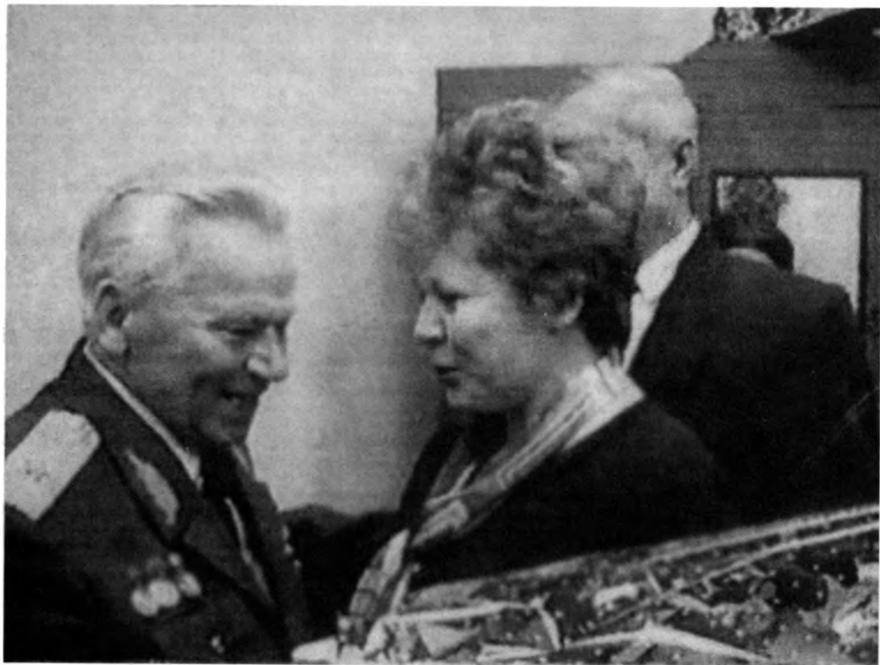
М.Т. Калашникова на приеме в Государственном театре оперы и балета поздравляет председателя Комитета по делам архивов при Правительстве Удмуртской Республики Н.К. Коробейникова. 11 ноября 1999 г.

После госпитального лечения мне был предоставлен домашний отпуск, во время которого я разработал и предложил новый образец вооружения 4 . В 1943 г. после изготовления первых образцов я был направлен в Москву для окончательного решения, где и был зачислен конструктором отдела изобретательства Красной армии 5 . С 1943 по 1949 г. я самостоятельно разрабатываю несколько новых образцов 6 . За один из наиболее совершенных образцов 7 мне в 1949 г. было присвоено звание лауреата Сталинской премии первой степени 8 .