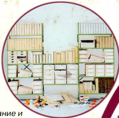
Оборудование и материалы для реставрации и консервации