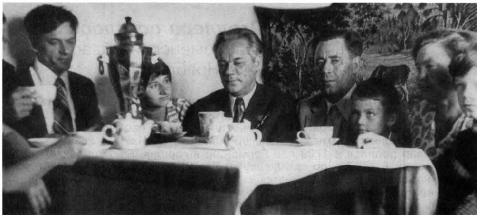
В кругу родственников. М.Т. Калашников (в центре), сын Виктор (слева) и дочь Наташа. Курья, 1 августа 1977 г.