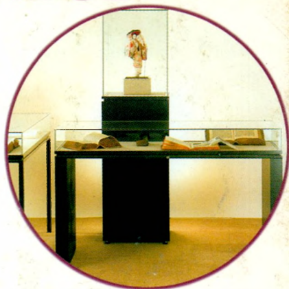
Оборудование для выставок (витрины, системы экспозиционных перегородок)