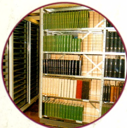
Стеллажи стационарные и передвижные