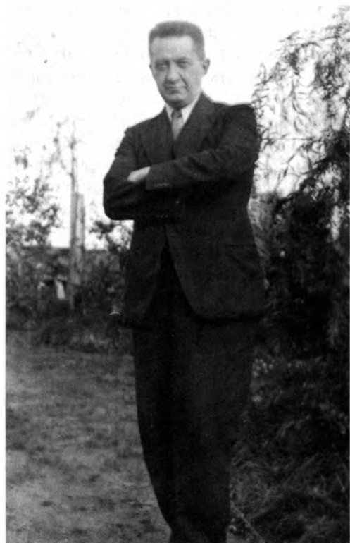
А.Ф. Керенский. Январь 1932 г.