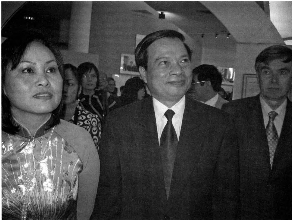
Начальник Государственного управления по делопроизводству и архивному делу Вьетнама Ву Тхи Минь Хыонг, министр внутренних дел Вьетнама Чан Ван Туан, чрезвычайный и полномочный посол РФ в СРВ В.В. Серафимов на выставке

Союзе в 1920–1930-х гг. Основной раздел включал документы о сотрудничестве СССР и Вьетнама в деле подготовки кадров в 1950–1991 гг. (решения Политбюро ЦК ВКП(б) о приглашении в СССР вьетнамских специалистов для обучения и повышения квалификации, приеме в Советском Союзе делегаций вьетнамской молодежи; советско-вьетнамские соглашения о подготовке специалистов и квалифицированных рабочих; переписка органов управления образованием, академических и учебных заведений СССР и Вьетнама; планы работы и отчеты советских специалистов, командированных для