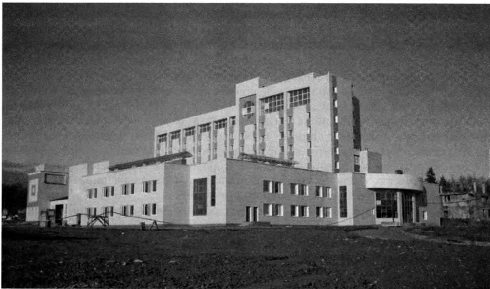
Филиал РГАЭ в пос. Вороново Подольского района Московской области

Прошедший год с точки зрения условий функционирования архивов не был благоприятным. Финансово-экономический кризис, фактический секвестр бюджетных расходов поставили перед архивами сложные задачи. Во многих субъектах Российской Федерации финансирование сократилось более чем на 30 %, и пришлось вводить жесткий режим экономии и ограничиться обеспечением в основном таких приоритетных направлений работы