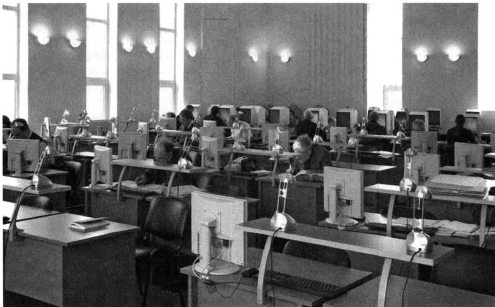
Читальный зал ГАРФ и РГАЭ с пользовательскими терминалами для доступа к базам данным электронных описей

Весомым научным итогом ушедшего года является новая редакция Перечня типовых управленческих документов, образующихся в деятельности государственных органов, органов местного самоуправления и организаций, с указанием сроков хранения. В отличие от предшественника с примерно пятью сотнями статей новый перечень содержит свыше тысячи статей по видам документов. Многие, вероятно, имели возможность следить за публичным обсуждением проекта перечня на форуме портала «Архивы России», где было высказано немало замечаний (как справедливых, так и ошибочных); по его результатам в перечень внесены уточнения. В ближайшие