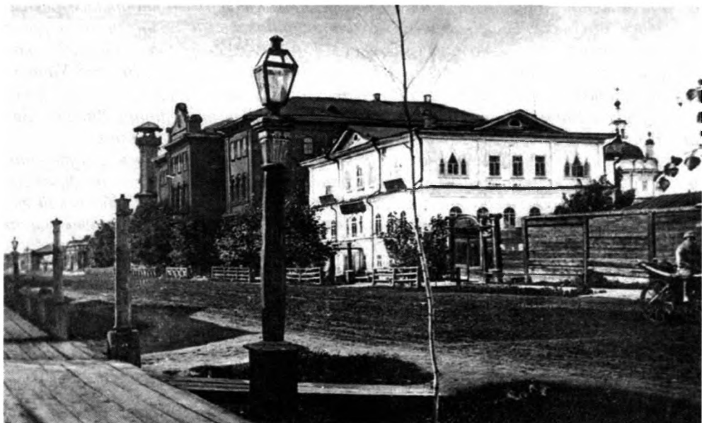
Дом Городского общества и мужская гимназия г. Енисейска. 1921 г.

Многие золотопромышленники Енисейска занимались благотворительностью, попечительством. Город обязан им зданиями и ансамблями купеческих усадеб, выполненными в разнообразных архитектурных стилях (классицизм, тобольское барокко, модерн и др.) и являющимися достопримечательностями исторического центра. Одно из самых монументальных зданий – мужская гимназия, построенная тоже в основном на пожертвования купцов в 1876–1886 гг. Тогда здесь открылись первое в Восточной Сибири женское училище, прогимназии, театр (1855 г.), публичная библиотека (1864 г.), типография, естественноисторический и культурно-бытовой музей, метеоро-