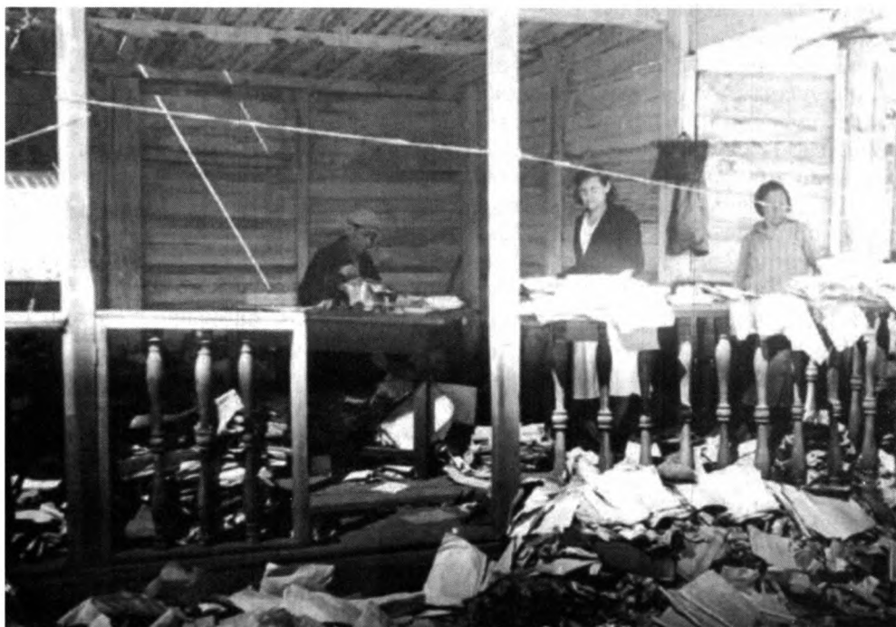
Разбор документов после наводнения в 1937 г.

В настоящее время в архиве в 322 фондах хранится свыше 40 тыс. ед. хр., в том числе 14 432 ед. хр. по личному составу. В дореволюционных (14 фондов, 437 ед. хр.) имеются сведения о городских и уездных церквах, развитии и состоянии золотопромышленности, устройстве водных и железнодорожных путей, о социальной и культурной жизни старинного города (ее наиболее полно отражают отчеты о деятельности городской управы).