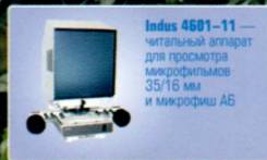
Indus 4601-11 — читальный аппарат для просмотра микрофильмов 35/16 мм и микрофиш АБ