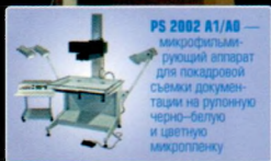
PS 2002 A1/A0 — микрофильм- рующий аппарат для лазерной съемки докумен- тации на рулонную черно-белую и цветную микроплёнку