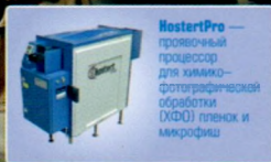
HostertPro — проявочный процессор для химико- фотографической обработки (XFO) пленок и микрофиш