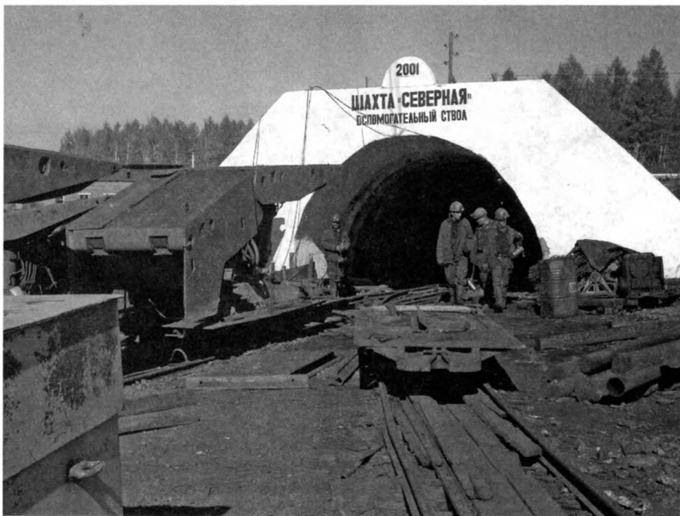
Шахта «Северная» ОАО «Ургалуголь». 2008 г. Ф. 103. Оп. 6. Д. 52

На хранение уже приняты фотодокументы Собрания депутатов района и молодежной палаты Собрания депутатов, городских и сельских Советов