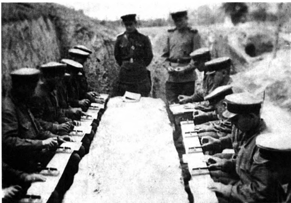
Рота на занятиях в полевых условиях. 0-105322

Важным вкладом Узбекистана в победу над фашизмом, наряду с производством вооружения и обеспечением действующей армии всем необходимым, была подготовка кадров в военных училищах. В Центральном государственном архиве кинофотофонодокументов Республики Узбекистан (ЦГАКФФД РУз) хранятся фотоснимки строевых и тактических занятий в Ташкентском пехотном и Чирчикском танковом училищах в 1943 г. 1 Большинство фотографий носит постановочный характер и не дает полной