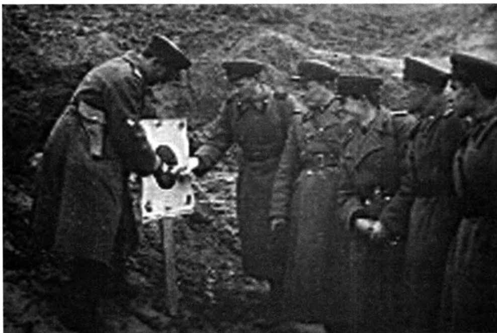
На занятиях по огневой подготовке политсостава. ЦГАКФФД РУз. Фотоотдел. 0-105196

Автору фоторепортажа удалось запечатлеть самое характерное и важное в деятельности данного учебного заведения, начиная с принятия присяги. С курсантами вели большую работу по разъяснению ее значения (знакомили с текстом присяги, организовывали беседы и пр.) 4 . На снимках видно, как ее принимали курсанты 6-го набора: во дворе выстроились учебные роты и взводы, был митинг, где выступил начальник курсов, затем состоялось принятие присяги, а после – торжественное прохождение курсантов перед импровизированной трибуной, где разместился командный состав.