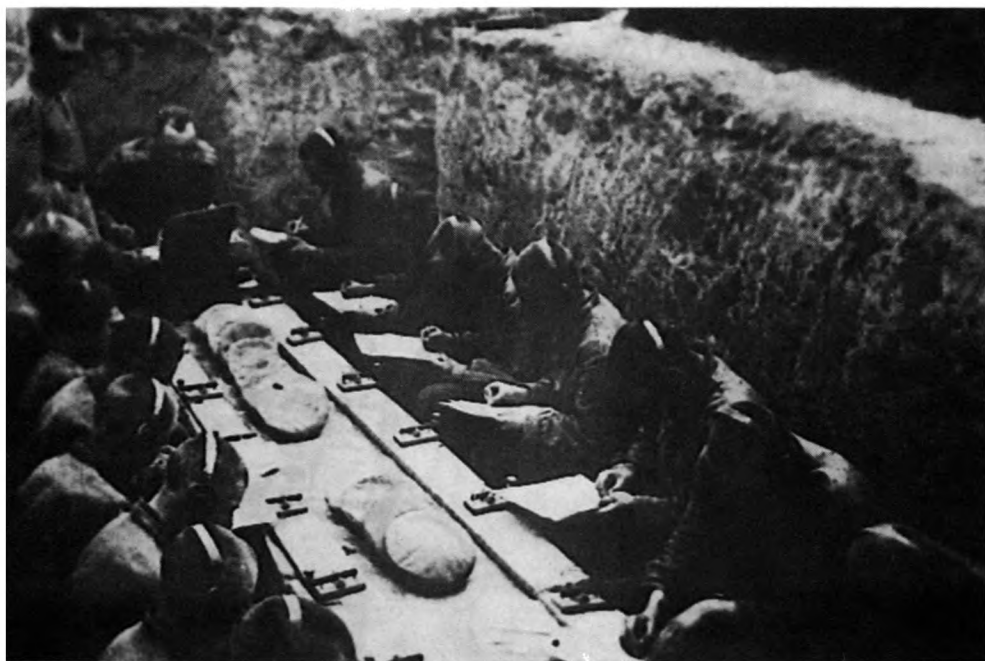
Идут учебные занятия роты в условиях, приближенных к боевым. ЦГАКФФД Руз. Фотоотдел. 0-105321

Владелец архива А.А. Иванов подтвердил, что фотографом действительно был Абрам Петрович Штеренберг – известный советский мастер художественной и документальной фотографии 2 , в годы войны старшина роты Третьих радиотелеграфных курсов. Вскоре автору данной статьи удалось