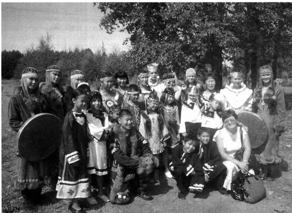
Участники краевого фестиваля-эстафеты фольклорных и обрядовых праздников «Бубен дружбы», пос. Средний Ургал. 2008 г. Авт. Т.Г. Юдина. Ф. 9. Оп. 4. Д. 6

На хранящихся в архиве снимках запечатлены школы, торгово-общественные центры, вокзалы, пожарная часть, детские сады, жилые дома, улицы; радостные (празднование дней сел и поселков, проведение выставок народного творчества, спортивных соревнований и др.) и трагические (последствия урагана 2007 г.) события. Все они составляют фотолетопись жизни Верхнебуреинского района.