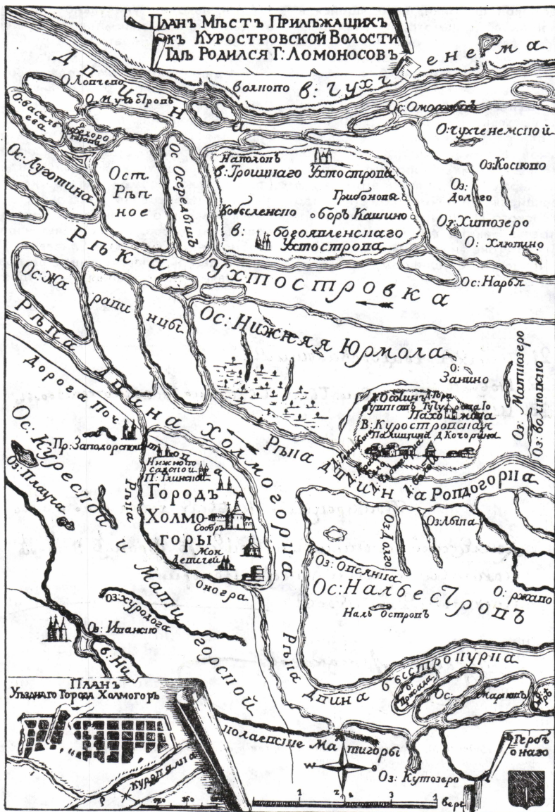
План Курортровской волости

сии — МАМЮ и МГАМИД представили на эту выставку богатейшие материалы. В одном из дел канцелярии МАМЮ («О высылке документов на Ломоносовскую выставку») сохранились: пригласительный билет и программа выставки, в соответствии с которой для нее подбирались документы, перечни и другие материалы. Для отбора дел в этот архив из Петербурга был послан секретарь комиссии по устройству выставки, известный ученый-пушкинист Б. Л. Модзалевский 24 . К апрелю 1911 г. перечень документов МАМЮ был готов, его первый раздел, озаглавленный «Документы, относящиеся к М. В. Ломоносову», включал 16 уникаль-