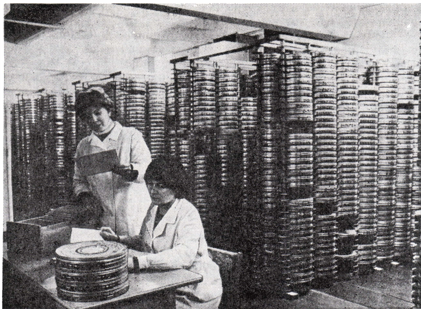
В новом фильмохранилище