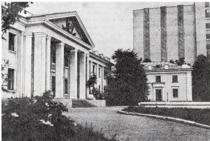
Здания ЦГАКФД СССР, справа новое архивохранилище

Важность собирания кинофотодокументов не раз отмечалась видными партийными и советскими деятелями. Н. К. Крупская, выступая на III Всесоюзном совещании кинохроникеров (декабрь 1934 г. — январь 1935 г.), говорила: «Важно, чтобы пленки кинохроники не разбрасывались, не уничтожались, чтобы они не имели только временного значения — их важно сохранять для того, чтобы можно было восстанавливать исторические факты, показывать, как было дело, в каком окружении происходило то или другое событие. ... Работы на кинохронике — это часть строительства социализма, и часть очень серьезная...» 2 .