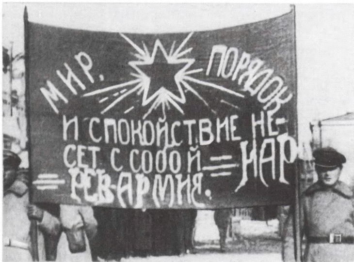
Кадр из кинофильма «Великий путь». Вступление Народно-революционной армии ДВР во Владивосток. 1927 г.