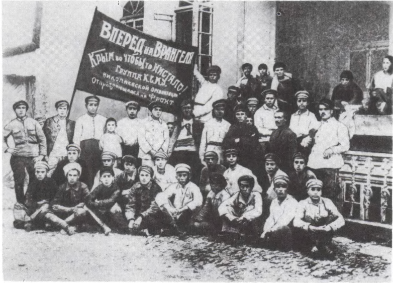
ЦГАКФД СССР. Комсомольцы г. Николаева перед отправлением на Врангелевский фронт. 1920 г.