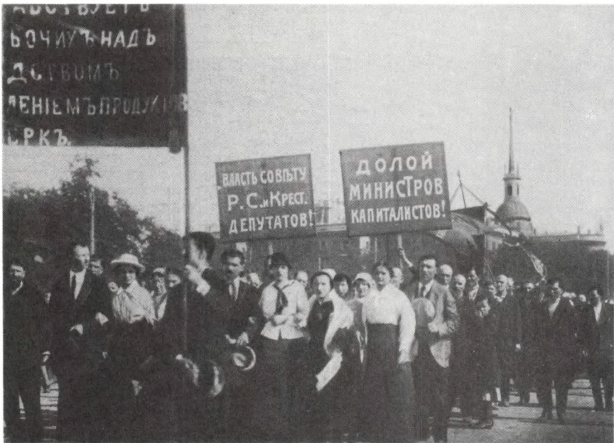
ЦГАКФФД г. Ленинграда. Колонна демонстрантов на улице Петрограда. 18 июня 1917 г.