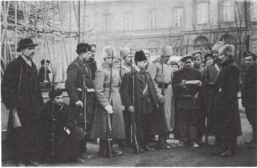
Проверка документов у входа в Смольный. 27 октября 1917 г.