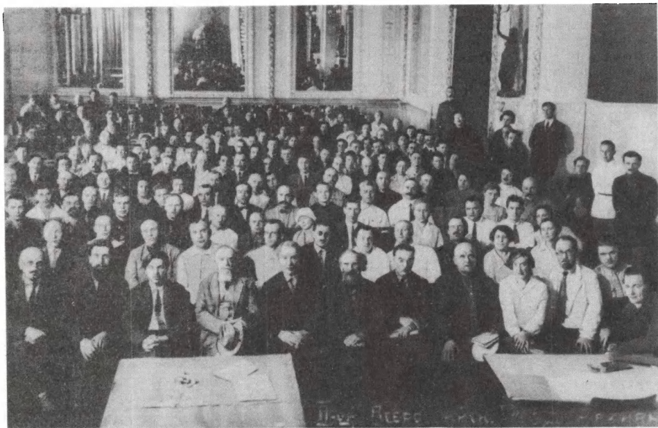
ЦГАКФД СССР. Делегаты Второго съезда архивных работников РСФСР (в центре М. Н. Покровский). 25 мая 1929 г.

Организован Центрархив Киргизской АССР. Центрархив и АОР издали сборник документов «Крестьянское движение в 1917 году».