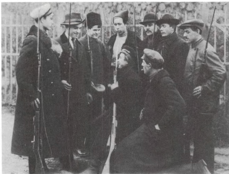
Красногвардейский пикет на одной из улиц Петрограда. Октябрь 1917 г.