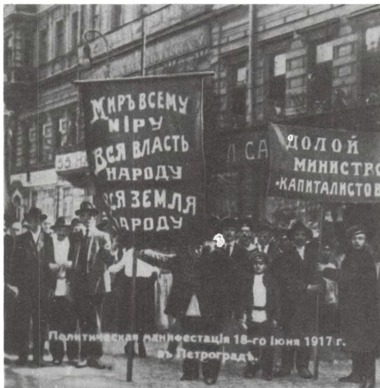
Организованная большевиками демонстрация протеста трудящихся Петрограда против политики Временного правительства. 18 июня 1917 г.