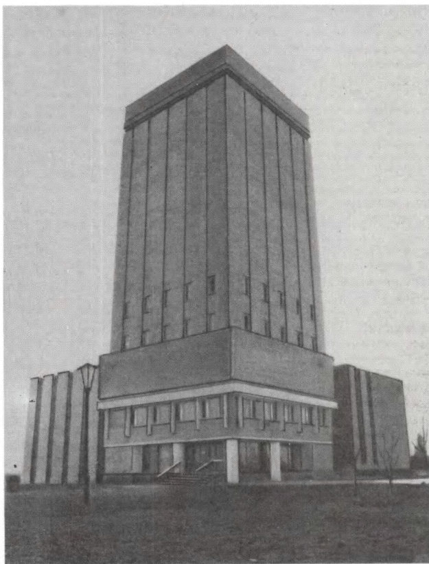
Новое здание ЦГАКФФД БССР

С учетом совершенствования управления и структурных изменений в народном хозяйстве происходит пересмотр действующих списков источников комплектования, что позволяет на научной основе определить состав документов, которые поступят на госхранение. С этой целью внедряются «Примерные списки видов учреждений, организаций и предприятий, являющихся и не являющихся источниками комплектования государственных архивов» (М., 1986). Оказывается организационно-методическая помощь Госагропрому БССР и подведомственным ему учреждениям в организации архивных и экспертных служб, по обеспечению своевременного и качественного отбора документов к передаче на госхранение, разработке