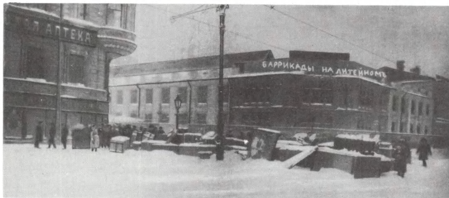
Баррикады на Литейном. Петроград. Февраль 1917 г.