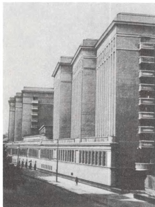
ЦГАКФД СССР. Комплекс зданий архивного городка, вид с М. Пироговской ул. 1947 г.