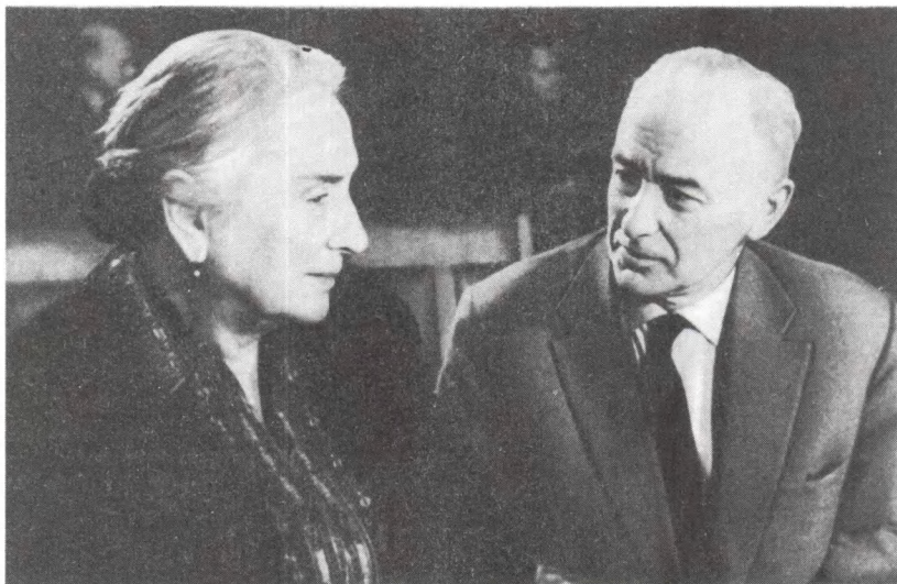
ЦГАКФД СССР. Кадр из киножурнала «Архивист № 3». Долорес Ибаррури и Роман Кармен в ЦГАКФД СССР. 1961 г.

В Москве на Б. Пироговской улице закончено строительство комплекса зданий центральных государственных архивов.