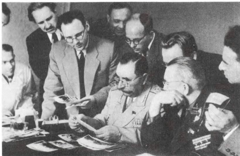
Кадр из кинофильма «Наш Красногорск». С. М. Буденный во время посещения архива. 1957 г.

Начала издаваться многотомная серия сборников документов «Из истории международной пролетарской солидарности».