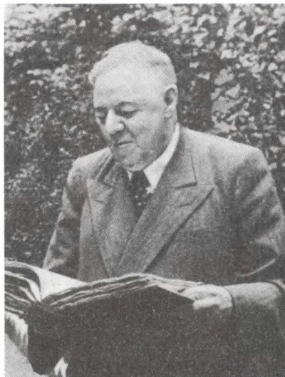
ЦГАКФД СССР. Кадр из кинофильма «30-летие ГАУ МВД СССР». Академик Е. В. Тарле в архивном городке. 1948 г.

Государственные архивы, расположенные в Москве, приняли участие в выставке, посвященной ее 800-летию.