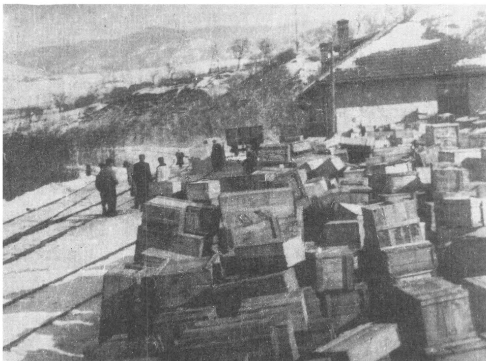
Резэвакуация документов в государственные архивы Молдавии

ния, т. е. создания необходимого научно-справочного, поискового аппарата. Данная работа и стала до конца 50-х годов одной из основных для архивистов Молдавии. Но не только этим характеризовалась деятельность архивов.