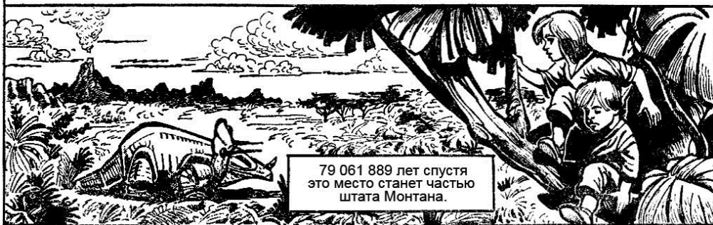
рис. Кожевникова И.В.

79 061 889 лет спустя это место станет частью штата Монтана.