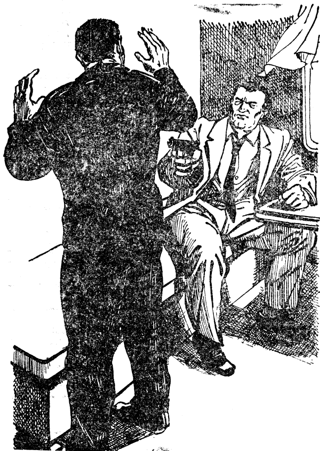
Художник И. Кожевников

значена простой проволокой на колышках. Я осматриваюсь: конвоиров трое, рядовые солдаты, по всем признакам — зеленые новобранцы. И тут же мысленно ахаю: неподалеку от меня стоит и смотрит в мою сторону незнакомый лейтенант. Видать, это и есть командир взвода, который так любит пулевую стрельбу. В кобуре у него пистолет. Пистолет — на автомат, из пистолета в бегущего попасть не так просто. Не так просто, если ты — простой офицер, не снайпер.