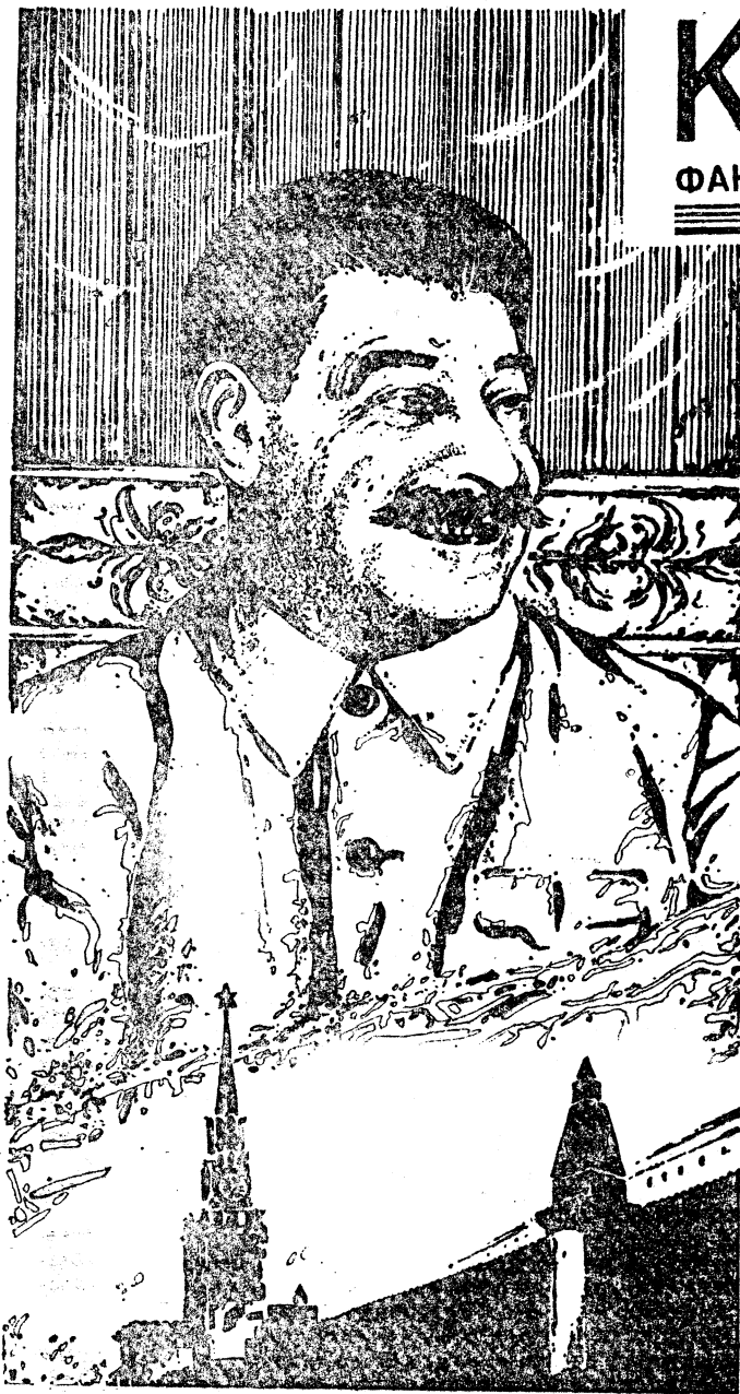
Художник С. ГРИГОРЬКИН.

лейшей степени не отвечать за его достоверность, он намеренно затушевывает возможность уяснить, когда именно происходили те или иные описанные здесь события. Читатель убедится, что в одном и том же эпизоде одни обстоятельства указывают на довоенные времена, а другие — на послевоенные; одни более характерны для начала тридцатых годов, другие — для их конца. Читатель да не будет раздражен этими противоречиями, а примет их как неизбежную условность. Возможно, когда-нибудь документы все-таки будут найдены, и тогда эта история предстанет перед нами в своей подлинности; скорее всего, она будет мало похожа на то, что вы сейчас прочтете.