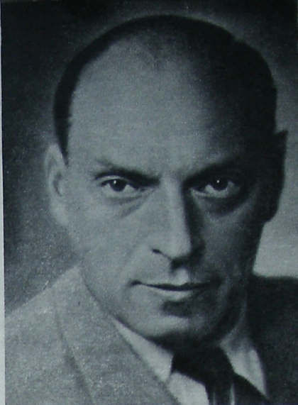
Ю. РАЙЗМАН, кинорежиссер, нар. арт. Латвийской ССР

Надеюсь, что моя мечта осуществится в самое ближайшее время.