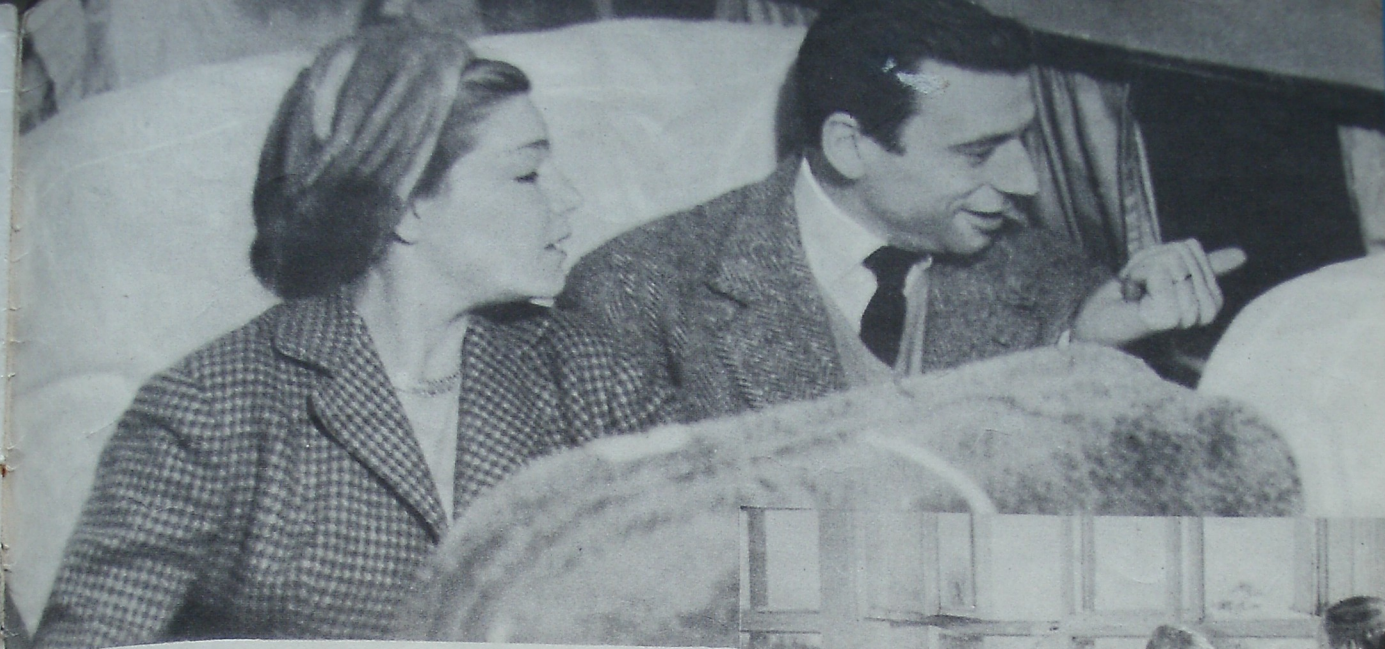
Кадры из новых документальных фильмов: «Певец Парижа», «Школьные годы» и «У Падунских порогов».

диманской ки- тат», Артистка ьниз и артист ер