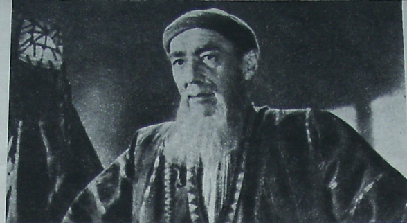
Алим-ата — народный артист Узбекской ССР Абид Джалилов