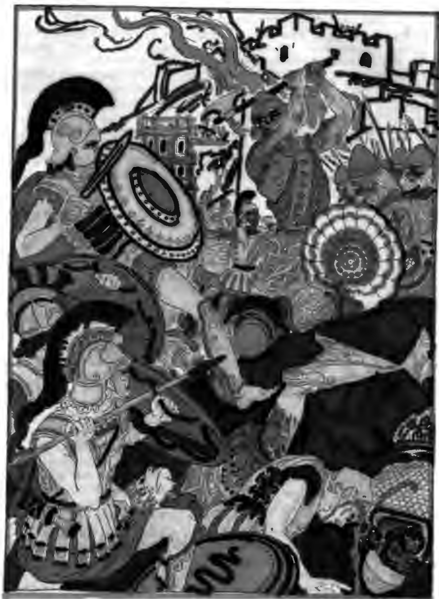
Это была большая битва. Бились среди развалин разрушенной внешней стены, бились у проломов...