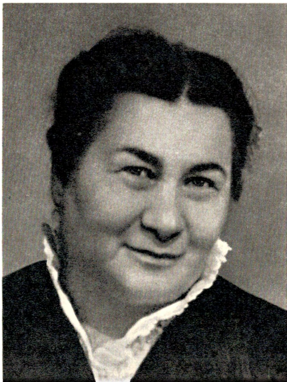
Любовь Федоровна Воронкова