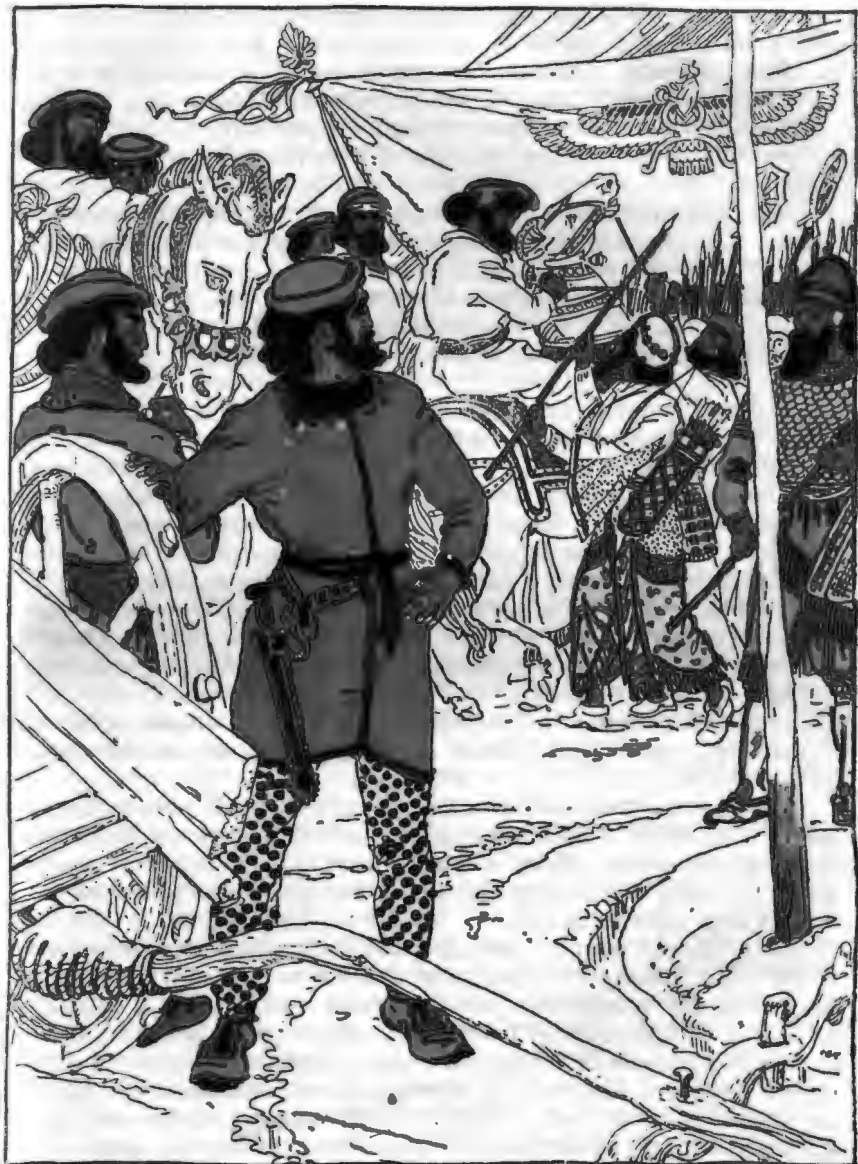
Спитамен увидел Оксиарга на коне...