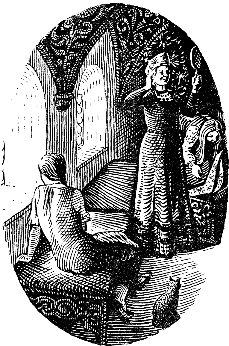
Старшие сестры от радости рехнулись.